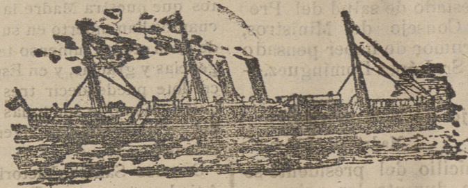
Tipo de los nuevos vapores de la Compañía.