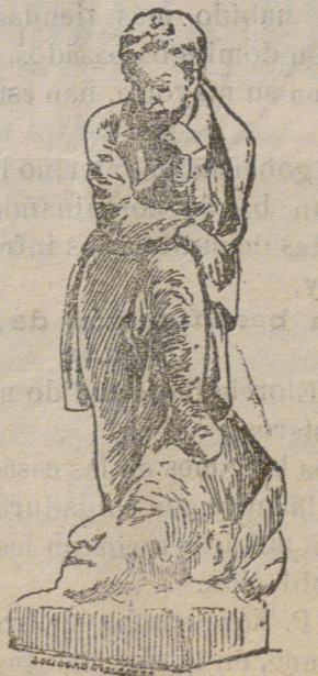
Estatua de Champollion, sabio egipcio.

Último retrato de Dreyfus, oficial del Ejército francés recientemente rehabilitado por sentencia del Supremo Tribunal de Casación de la República francesa.