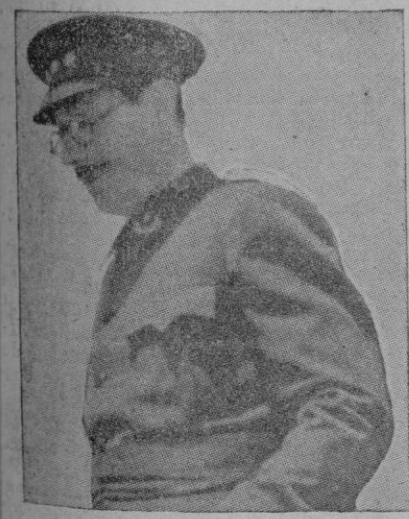
El General Varela

El coronel don Juan Beigbeder Atienza ocupó hasta ahora la Alta Comisaría de España en Marruecos. Hombre enormemente conocedor de los problemas exteriores de España, especialmente de los que atañen a nuestro protectorado marroquí, ha sido uno de los más eficaces servidores