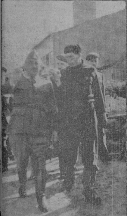
Caudillo recorre el pueblo de Cayón escucha del Presidente del Pósito de Pescadores las aspiraciones del pueblo

Y aún hubo que añadir que serían atendidas las dos peticiones que le formularon los cayonenses: que se dotara al pueblecillo de una grúa, para poder sacar fácilmente los barcos a tierra en días de temporal, y que se destinara un camión para el transporte del pescado desde Cayón hasta la ciudad más inmediata.