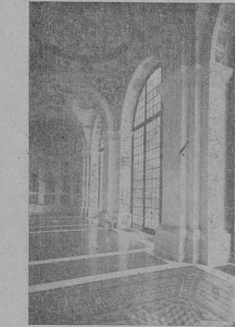
Un interior de la Villa Madama, donde se hospeda el Ministro de la Gobernación español durante su estancia en Roma

El aumento de precio de la gasolina será de 24 céntimos por litro y el gravamen sobre el gasoil será de 20 céntimos por litro.