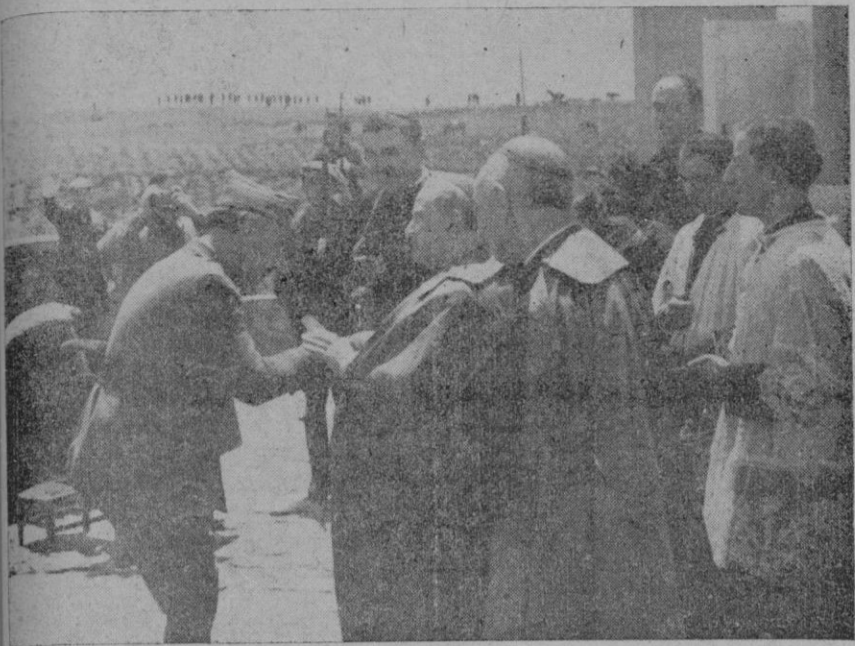
Caudillo, al llegar al monumento, besó el anillo al Arzobispo de Burgos

En Alcocero de Mola, con asistencia del Generalísimo, tuvo lugar la solemne inauguración del monumento al general Mola, levantado en el mismo lugar en que halló la muerte el ilustre general.