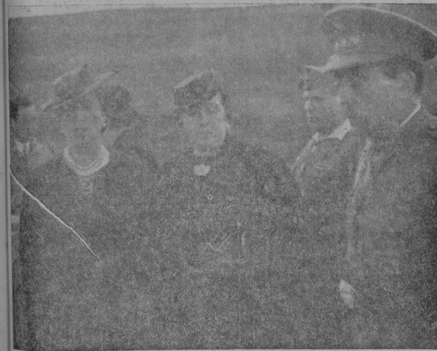
La esposa del Generalísimo con la viuda del general Mola y el coronel señor Franco Salgado.