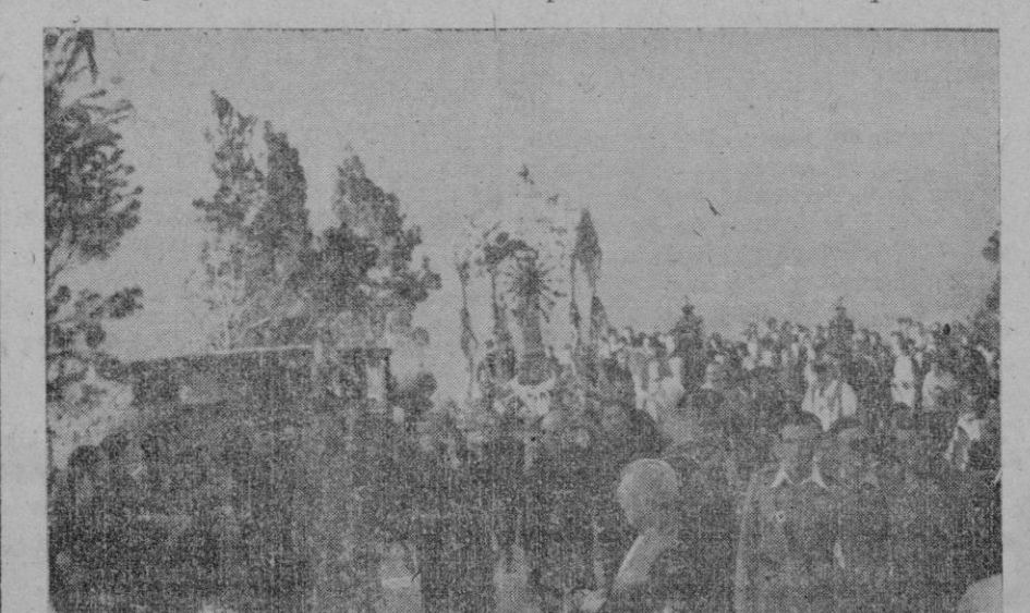
La venerada imagen de la Virgen de San Salvador fué trasladada procesionalmente, desde Felanitx, a su capilla. Nuestra foto recoge un aspecto de la devota procesion