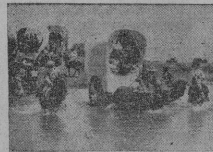
Las carretas de la romería cruzando el río

La Romería del Rocío es en Andalucía la romería más popular. Ligada a ella está el pueblo con vínculo indisoluble, no sólo porque el pueblo por tradición y substancia es católico y de exaltados sentimientos religiosos, sino también —y esto es lo más curioso— porque la Romería del Rocío representa una confusión armónica de momentos y matices del alma popular que se manifiestan con fuerte expresión de estampa típica, ya en la ruta, a veces llena de peripecias e incidentes pintorescos, ora en la marisma, ancha como el desierto, donde el repiqueteo de las castañuelas, ligado a los decires ingeniosos, pone una vibrante nota de alegría, de la alegría nativa andaluza, que contrasta con la impresionante grandeza severa del mar.