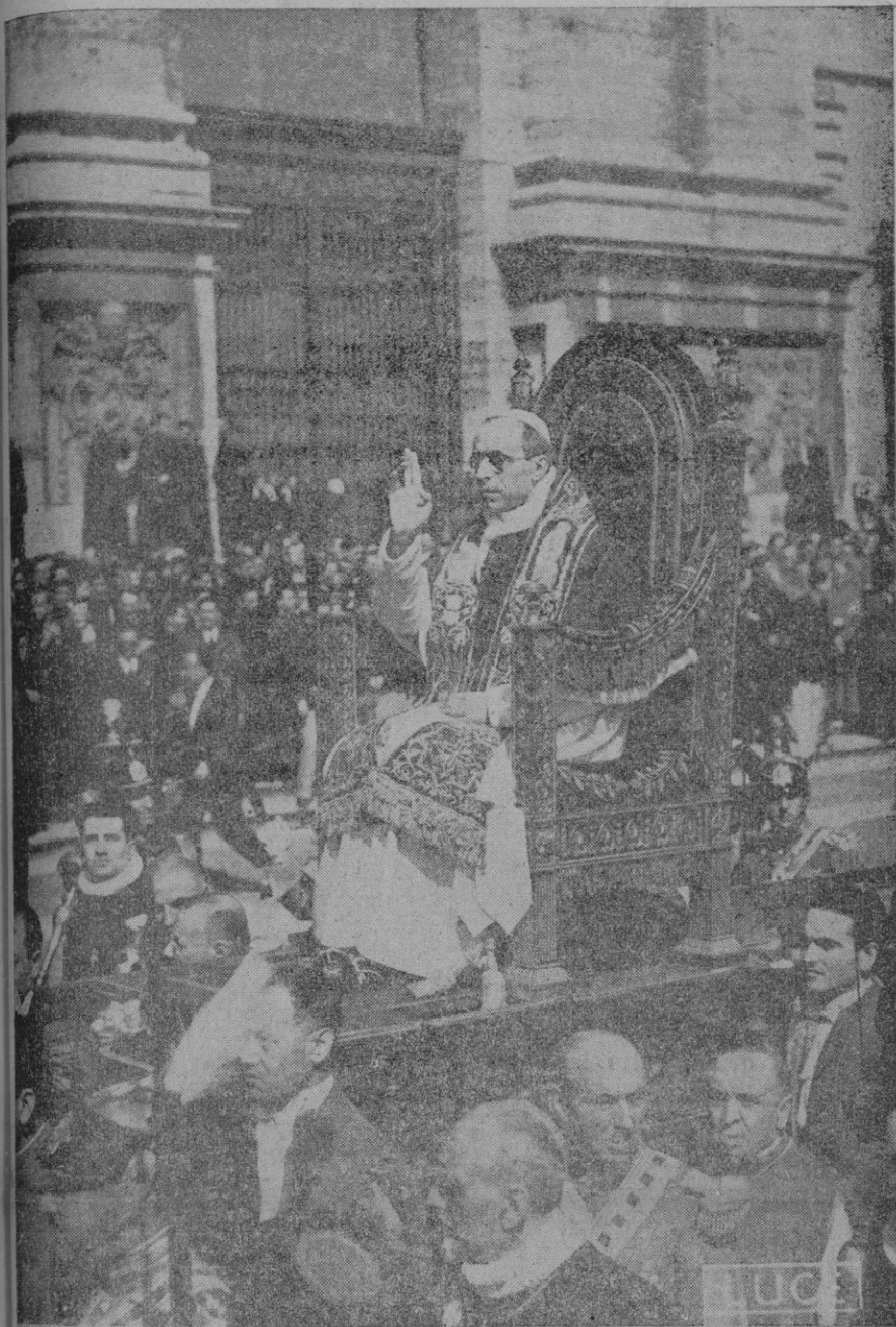
Santidad, llevado en la silla gestatoria desde el Palacio de Letrán a la basílica del mismo nombre, pasa benediciendo a la multitud.

Santidad hizo el trayecto desde el Vaticano a la basílica lateranense en automóvil descubierto. — El solemne rito de la toma de posesión