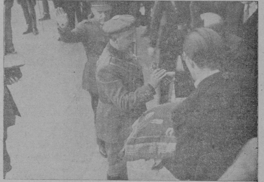
El Generalísimo, al llegar al Monasterio, recibe las llaves del mismo de manos del Superior de la Comunidad de PP. Agustinos

El Caudillo visitó, durante las fiestas de la Victoria, el Real Monasterio de San Lorenzo de El Escorial, donde se celebró brillantísima recepción diplomática