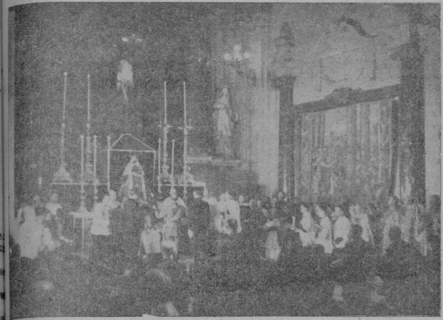
Momento en que el Generalísimo Franco dió lectura a la ofrenda de su espada al Señor

En las Salesas Reales, en Madrid, el Generalísimo Franco ofrendó al Altísimo su espada vencedora, que era la que le regaló la Legión, cuando ascendió a General