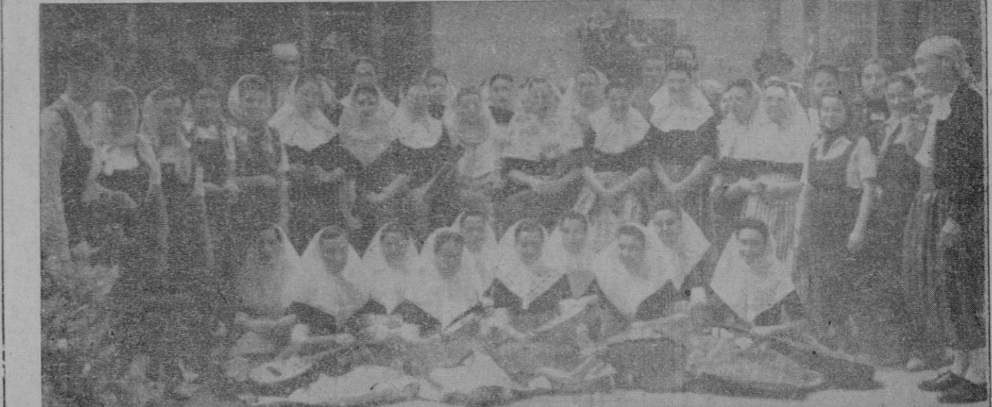
Y éste es el bello cuadro folklórico —gracia y solera de nuestra tierra— que Mallorca, en Castilla, ofrecerá al Caudillo y al Ejército vencedores, en la anunciada gran fiesta de las regiones