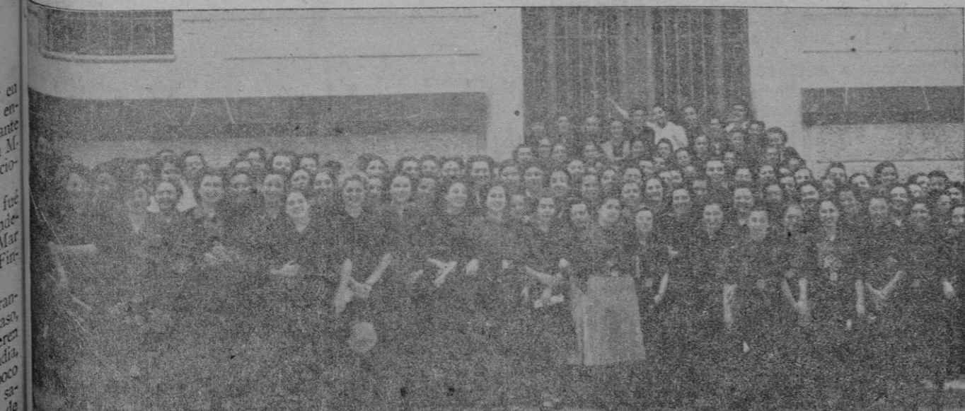
Este es un grupo —muy nutrido, por cierto— de las falangistas que hoy salen para Medina del Campo, llevando la representación de nuestra provincia

A tal extremo han llegado las cosas (Continúa al final de la primera columna de la segunda página)