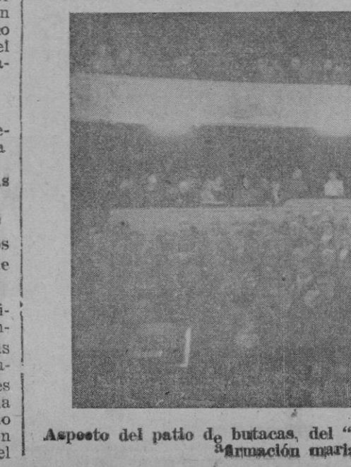
Aspecto del patio de butacas, del "Teatro Principal", durante el acto de afirmación mariana-congregacionista

El Jefe del Estado departió amigablemente con los asistentes y luego marchó hacia Madrid. La muchedumbre se había aglomerado a la carretera aclamando al CAUDILLO.