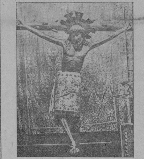
La histórica imagen del Santo Cristo de Lepanto, que fué venerada por el Caudillo en la iglesia de las Salesas, en Madrid

El Cardenal le contestó con las si- guientes palabras: "El Señor sea siempre contigo. Dios, de quien procede todo derecho y poder y bajo cuyo imperio están todas las cosas, te bendiga, y, con su providencia, siga protegiéndote, así como el pueblo que diriges". A continuación el Cardenal Primado dió la bendición al Jefe del Es- tado. El Cardenal y el CAUDILLO, se abrazaron. Y con esto terminó la magnífica e inolvidable ceremonia de acción de gracias por la victoria del CAUDI- LLO.