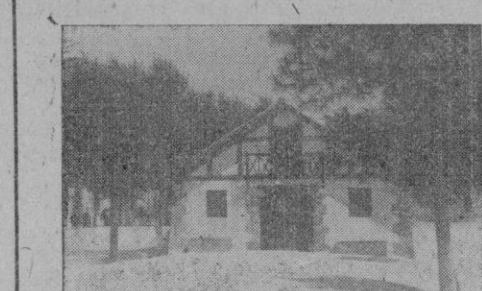
La "Casa vasca", en la explanada del muelle