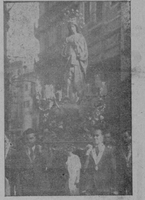
La imagen de la Inmaculada, de Montesión, llevada procesionalmente por sus congregantes

La vida, pujante, que siempre han tenido entre nosotros las beneméritas Congregaciones Marianas, y