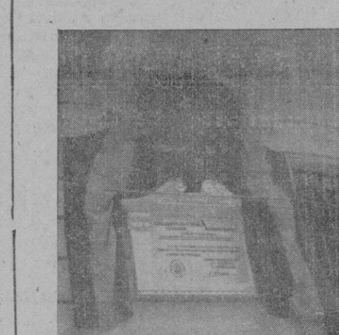
La lápida con el último Parte oficial de guerra, colocada en la fachada del nuevo edificio del Gobierno civil y descubierta anteayer solemnemente