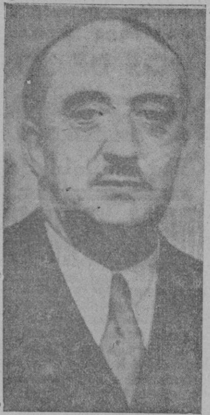
El nuevo Alcalde de Madrid, señor Alcocer

Tuvo el Alcalde de Madrid frases de elogio para su antecesor, un distinguido oficial del Ejército, quien, en los pocos días que ha desempeñado el cargo, ha logrado normalizar muchos servicios, y terminó su entrevista con los periodistas diciendo: — Queremos que Madrid, limpio de pecado, vuelva a ser la capital más hermosa y alegre del mundo.