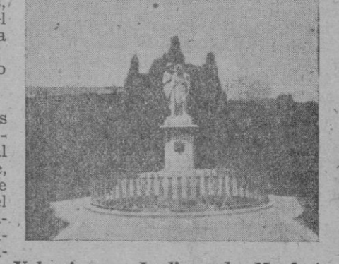
Valencia. — Jardines de Monforte

Bellísimas señoritas ataviadas con el traje regional, le entregaron ramos de flores. Muchos de éstos fueron depositados a los pies de la Virgen de los Desamparados. Mientras tanto, el desfile, brillante, apoteósico, de las tropas liberadoras continuaba triunfal: los soldados, casco sobre la cabeza, manta cruzada, fusil al hombro, con garbo, soltura y gentileza, con paso firme pasando por las calles de Valencia, entre murallas humanas que les aplaudían y vitoreaban sin cesar. Las gentes, desde los balcones y azoteas, arrojaban sobre los vencedores rosas y claveles y el entusiasmo fué aumentando hasta la una de la tarde, hora en que el desfile terminó. El pueblo de Valencia se había resarcido de su obligado silencio de tres años de temor: ayer gritó, hasta enronquecer, los nombres de la Patria, de su Caudillo y de sus liberadores.