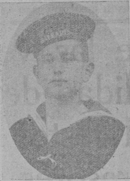
Aspirantes de la A. C. española!

Sirva su ejemplo de estímulo a todos sus compañeros aspirantes, que, como él, llevan prendida de su pecho la insignia del aspirantado de A. C. a la cual él nunca quiso abandonar.