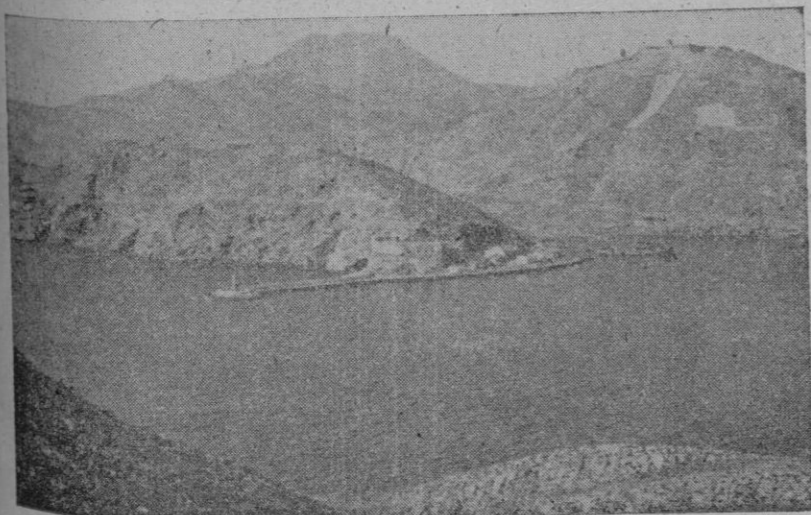
Cartagena. — Entrada al puerto.

Y los ojos y los brazos se han elevado al Cielo, gritando al mundo como España tiene presentes, ahora —cuando llega la paz de la victoria— más que nunca a los que, por darlo todo por mucho amarla y mejor servirla, dieron hasta la vida.