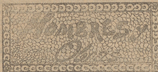
DON PEDRO A. DE ALARCON

Según datos que constan en el ministerio de la Guerra inglés, las mejores mulas para el servicio de campaña, por su gran resistencia, son las españolas, que están dando mejores resultados que las americanas.