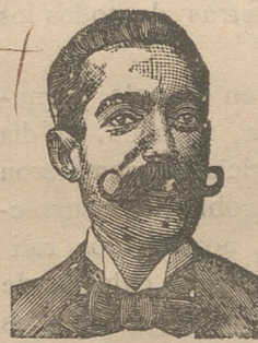
A. SALVATI COSTANZI

DEPOSITARIOS: Farmacia Moderna, calle del Hospital, 2.—Farmacia del Siglo, Rambla de las Flores, 23.—Farmacia del Dr. Borrell, calle Pelayo.—En Avila: S. Crespo, San Segundo, 8. Farmacia.