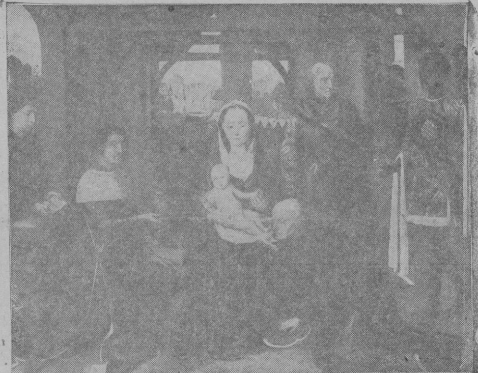
La Adoración de los Magos, pintura de Memling, existente en el Museo del Hospital de San Juan de Brujas

El cortejo real entre grandes aplausos se dirigió al Palacio de la Almudaina donde el Comandante General, acompañado del Jefe de Estado Mayor y sus ayudantes les dió cariñosa bienvenida, marchando luego los Reyes Magos a la Capilla del Palacio de la Almudaina, donde después de orar breves momentos ante el Nacimiento que en él hay instalado ofrendaron incienso y mirra al Niño Dios. Una hermosa estrella que descendió sobre los Magos al entrar en la capilla real, estuvo sobre ellos todo el