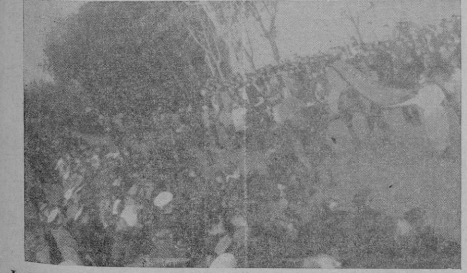
La cabalgata de los Reyes Magos al entrar en Palma por la avenida de Antonio Maura