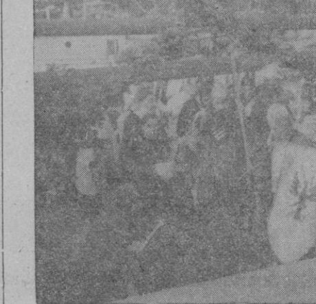
El desembarco de los Reyes en el muelle de Sagrera, en la tarde de ayer