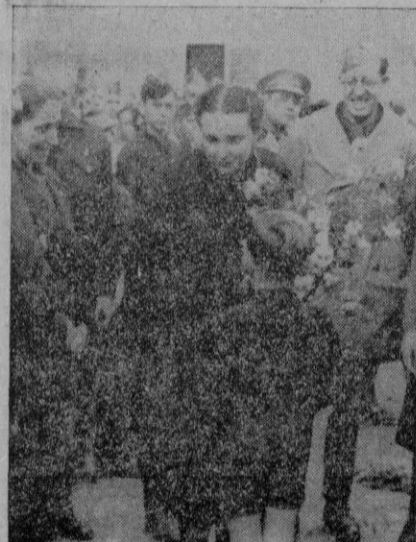
A su llegada a Manacor, la Delegada Nacional de "Auxilio Social", entusiásticamente recibida, fué obsequiada por un "flecha" con precioso ramo de flores