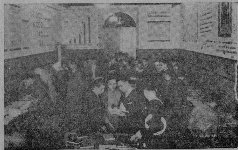
Salón de la Congregación Mariana de Montesión donde está instalada la Exposición de Prensa Mariana

Continúa a' final de la primera columna de la segunda página)