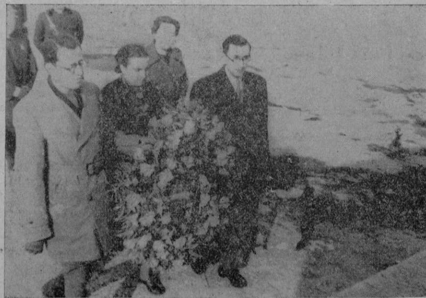
Con las jerarquías de la Delegación Nacional de "Auxilio Social", la fundadora y alma de la gran obra de paz va a depositar un ramo de rosas al pie del Monumento que en Porto-Cristo perpetúa la memoria de los que, defendiendo a Mallorca murieron por Dios y por España