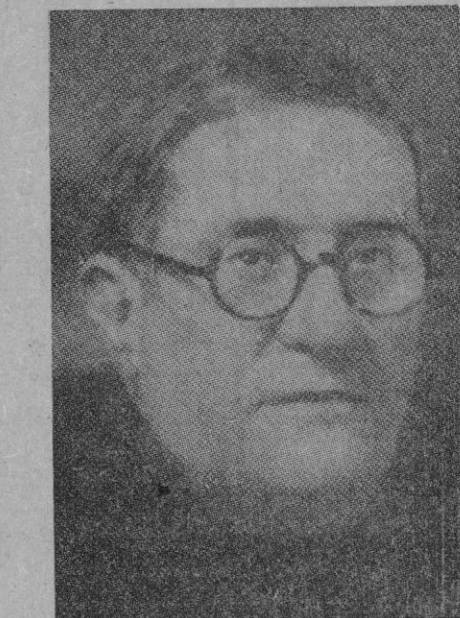
El franciscano P. Gemelli, fundador y rector de la Universidad Católica de Milán

Instituto de Ciencias económicas, Instituto de Economía financiera y Laboratorio de Estadística, todos ellos de la Facultad de Ciencias políticas, económicas y comerciales. La Facultad de Filosofía y Letras tiene los siguientes: Seminario de Filosofía,