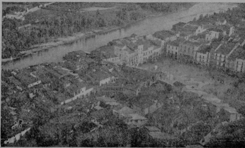
Vista de Balaguer, en la provincia de Lérida