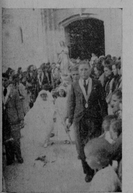
Un aspecto de la procesión de Corpus en Sineu

dos y lograr que, a la hora de la liberación de la España irredenta, se encuentren los nacionales con que la riqueza inmueble ha sido acaparada por extranjeros, muchos de ellos indeseables y judíos.