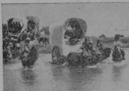
Las carretas de la romería del Rocío cruzando el río

carretas y jinetas, al lejano santuario de la "Blanca Paloma", como llaman los andaluces a la Virgen de las marismas.