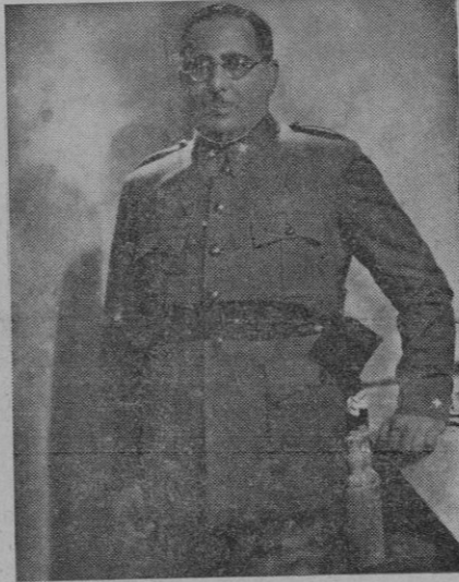
El General Aranda, jefe de las fuerzas gallegas