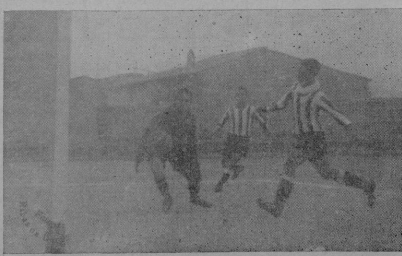
El primer tanto del partido logrado por el “Athletic”