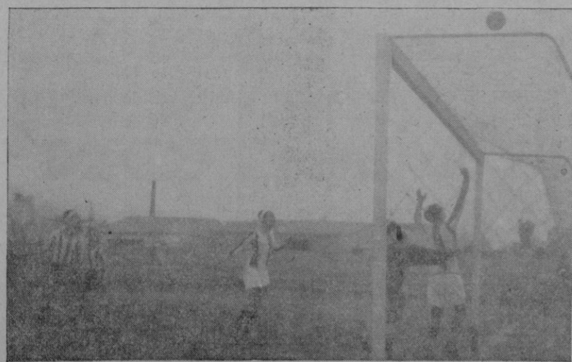
Un buen remate a la puerta del “Balears”, que Natalio rechazó

¡Buenas noches, señores! Siempre que se sueltan los gatillos, salen por todas partes conejos, que