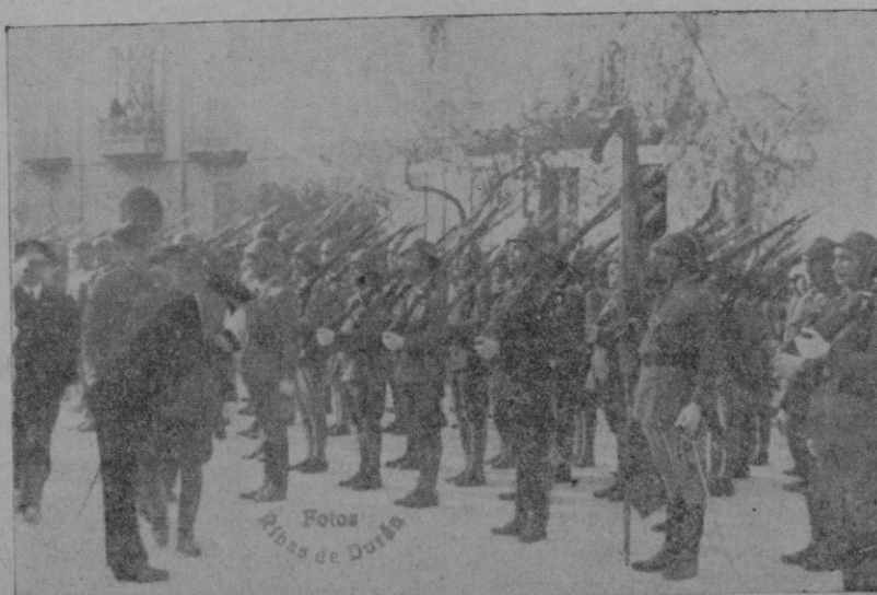
El Excmo. Sr. Vice-Almirante en el momento de saludar la bandera, al pasar revista a las fuerzas de Infantería