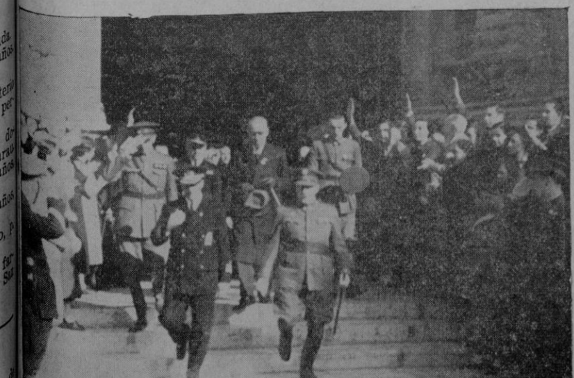
Las autoridades al salir ayer de la iglesia de San Francisco, después de la fiesta en honor de la Inmaculada

LA FIESTA MILITAR DE AYER EN HONOR DE LA INMACULADA CONCEPCION