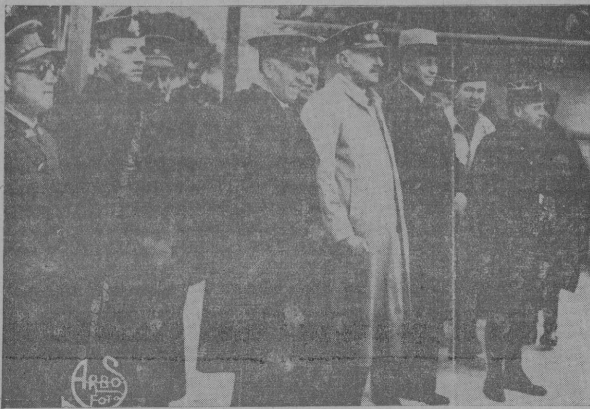
Grupo de primeras autoridades presenciando el amerrizaje del trimotor que cubre el servicio Roma-Cagliari-Pollensa y viceversa

Madrid. — El efecto causado por los bombardeos de los aviones nacionales