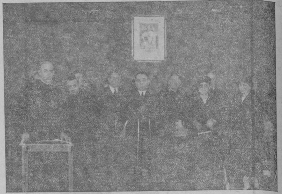
La presidencia, al inaugurarse las conferencias del P. Laburu

El Vicario de Jesucristo, hablando en plenitud de poderes, dice que los deberes de justicia hay que cumplirlos con los obreros, dándoles lo necesario para que puedan vivir: participación en los beneficios, salario familiar, etc. Muchos, para justificar su desidia y dejadez, dicen que se trata de un problema difícil y por eso ¡oh paradoja! no se preocupan de estudiarlo a fondo ni de darle solución.