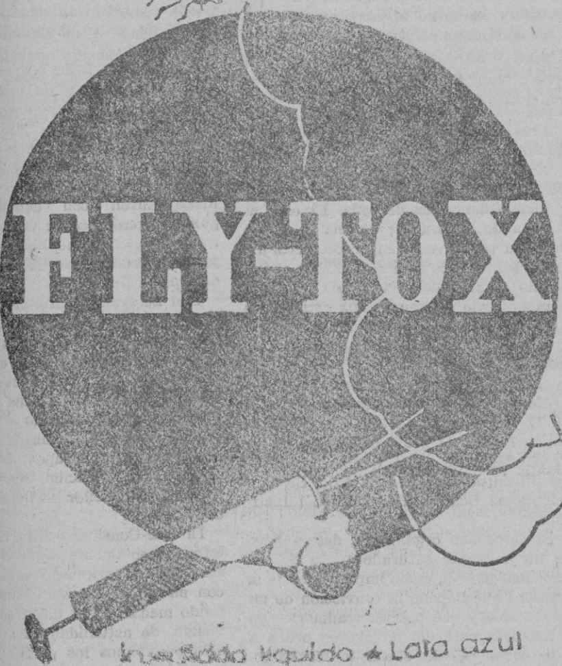
líquido líquido * Lata azul

ESCRIBA HOY MISMO A LA EDITORIAL "LA HORMIGA DE ORO, S. A." - Apartado, 26, Barcelona - y recibirá gratis y sin compromiso, un número de muestra.