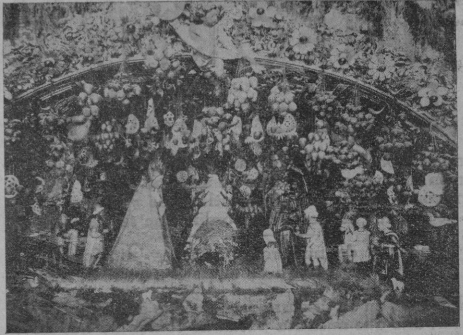
la festa de Santa Llúcia (13 de desembre). A Ciutat la féim una mica mes tart, en la solemni diada de Sant Tomàs apòstol.

En aquesta fira tradicional s'en fa memoria dels artistes anònims autors dels pastors d'argila. Antany s'hi reunien les célebres figuretes de Manacó, que utilitzaven les monges per a fer els seus Betlemets de regalo a les cases dels parents i benefactors.