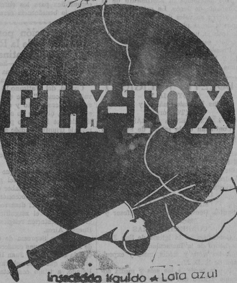
Insecticida líquido * Lata azul

Señora... No se lastime las manos cómprese un par guantes goma de CASA CODINA (Junto al Paseo del Borne)