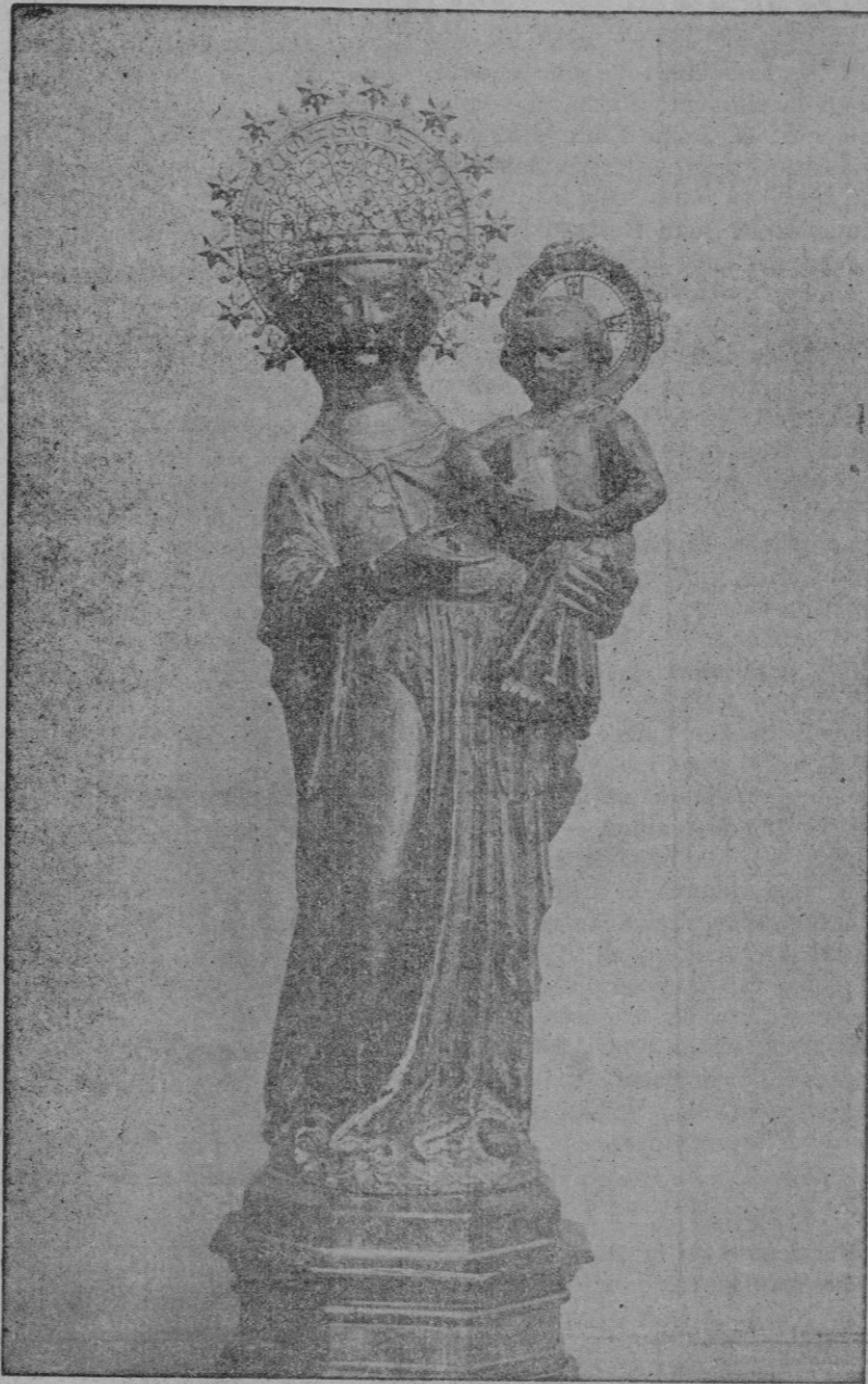
Veneradísima Imagen de Nuestra Señora de Lluch, Patrona de Mallorca

altares de la iglesia y en el erigido para esta solemnidad en la gran explanada del colegio, convenientemente exornada con arcos, inscripciones y emblemas.