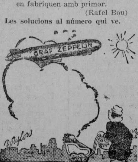
—Are pens que no he prés la llangonissa pel berenar!...