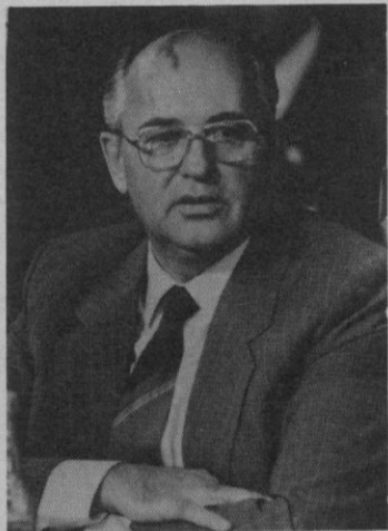
Mijail Gorbachov.

Moscú (Efe).—El Consejo de Estado de la URSS decidió ayer viernes, eliminar el Comité de Seguridad del Estado (KGB), con lo que oficializa el desmantelamiento de esta institución ordenado por el presidente soviético, Mijail Gorbachov, tras el fallido golpe de Estado de agosto pasado. En la reunión del Consejo de Estado se acordó que las estructuras del KGB servirán de base para crear un "servicio independiente de espionaje centralizado", un servicio interrepublicano de contraespionaje y un comité estatal de defensa de las fronteras de la URSS, informó la agencia independiente "Interfax". De hecho, la decisión de ayer no significa la desaparición del KGB, sino su transformación en una institución más acorde con las tendencias de-