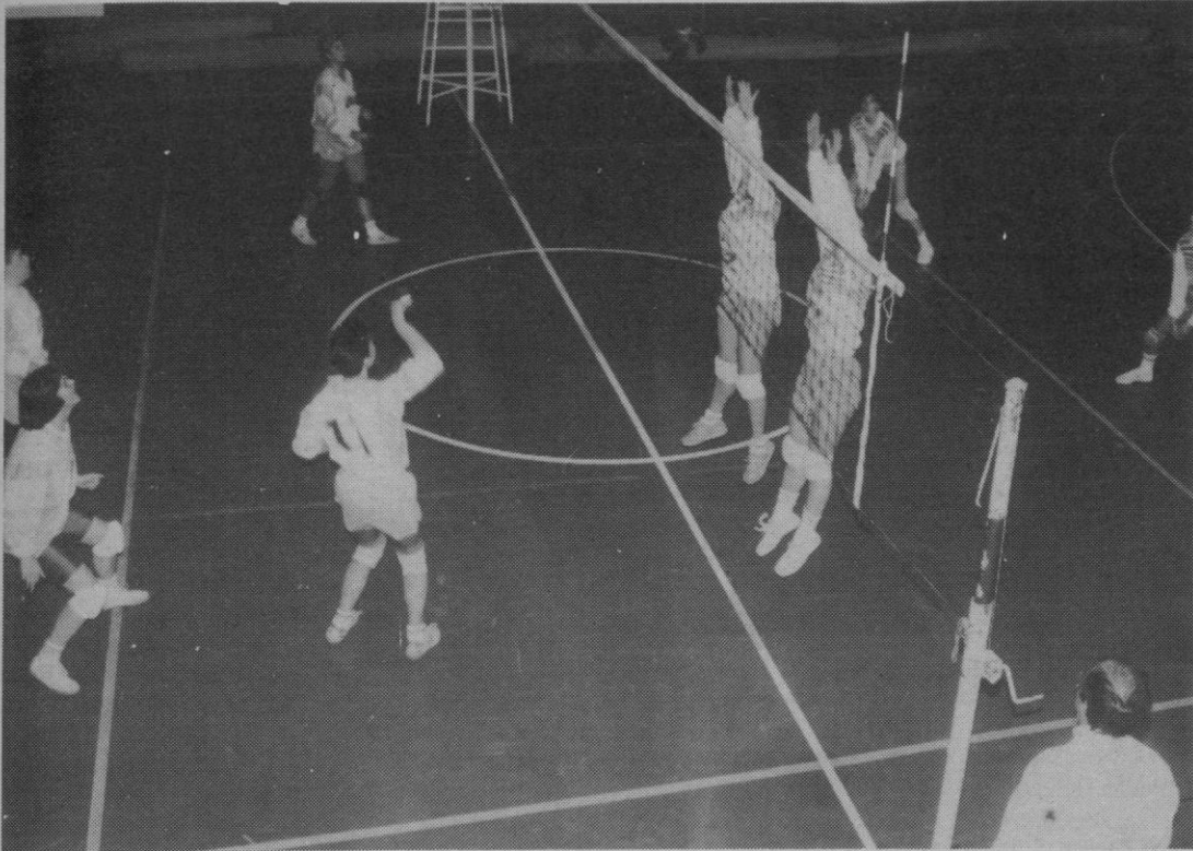
Las segovianas no pudieron con el Leopoldo Cano.