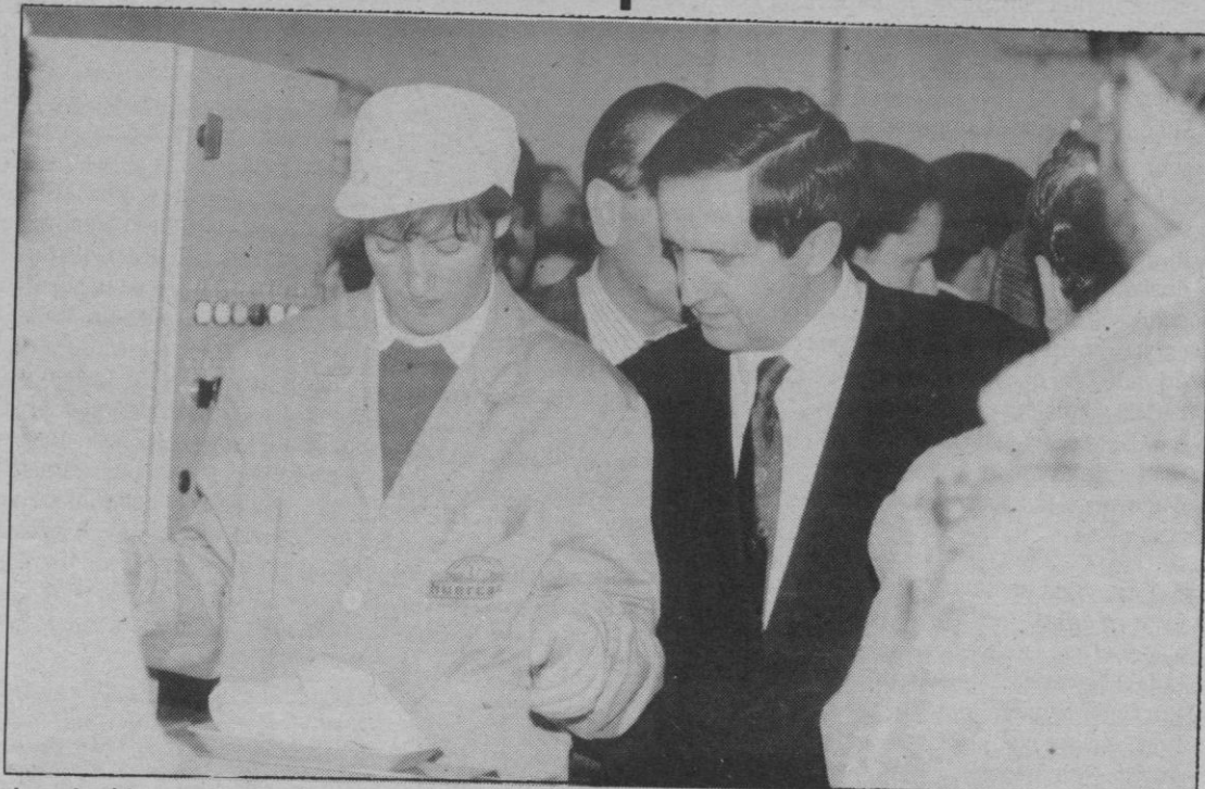
Juan José Lucas atiende a las explicaciones de una empleada de Huercasa.

Por otra parte, Juan José Lucas criticó con dureza el proyecto de ley socialista sobre Seguridad