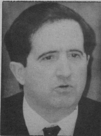
Juan José Lucas.

El presidente de la Junta no se sustrajo a la polémica que durante estos días está suscitando la ley de Seguridad Ciudadana. Lucas fue especialmente duro en sus críticas ante esta ley, que calificó como "paso alocado" del Gobierno socialista. "La aprobación de la ley Corcuera ha generado una tensión en las fuerzas políticas desde luego impensable hasta hace dos meses —declaró Lucas—. Por primera vez hay una extraña coincidencia extraña entre los grupos