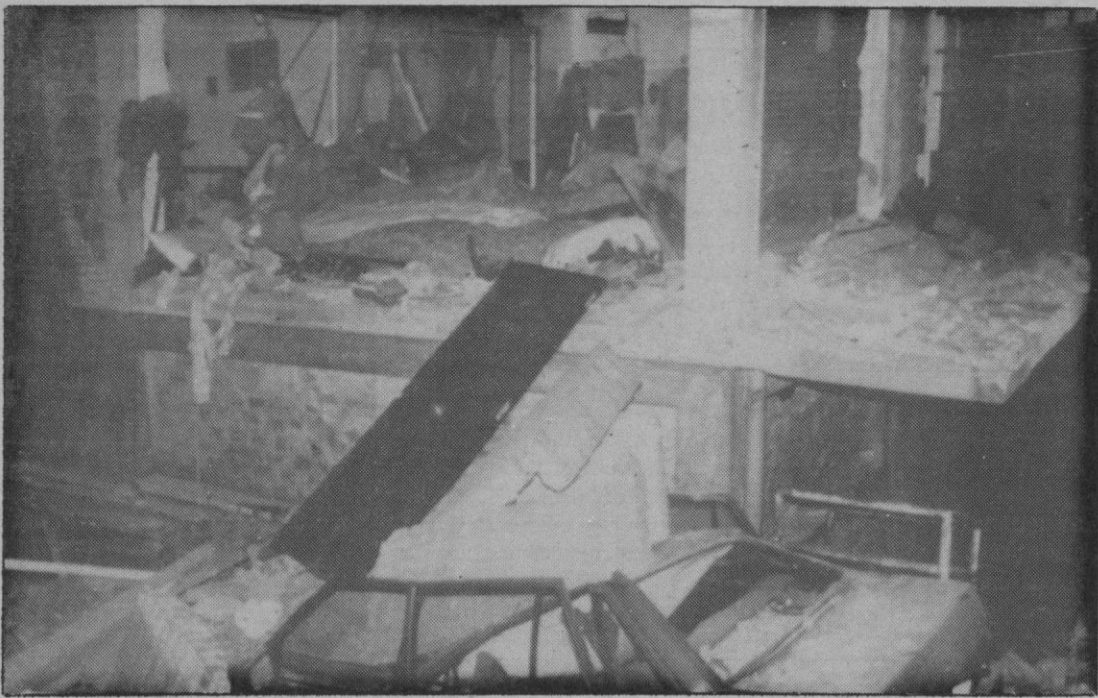
Estado en que quedó el edificio afectado por la explosión.