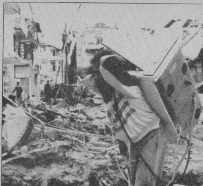
Un israelí transporta una lavadora entre las ruinas de Tel Aviv

Dicha fuente informó de que la incursión se realizó entre las 07,30 y las 08,00 gmt, cerca de la frontera con Kuwait sobre unidades de la Guardia Republicana iraquí. La otra incursión de "Jaguar" se efectuó contra baterías de artillería tierra-tierra, sitas a proximidad de la frontera sur de Kuwait, según Sirpa.