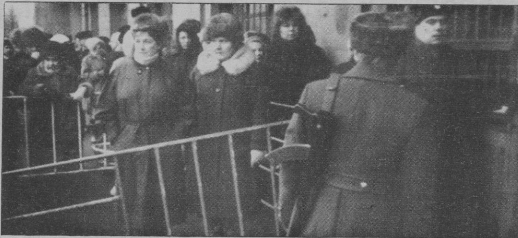
Policías soviéticos custodian la entrada del Banco Central de Moscú adonde acuden miles de ciudadanos para cambiar sus rublos.

Moscú.— La reforma monetaria para limitar el dinero soviético en circulación se ha cobrado al menos tres víctimas mortales en Moscú, dos en Leningrado y provocado algunos infartos de miocardio, especialmente entre ancianos. Las víctimas se produjeron durante las largas colas que tuvieron que soportar los ciudadanos soviéticos para cambiar los repentinamente ilegales billetes, según informó la prensa de la URSS.