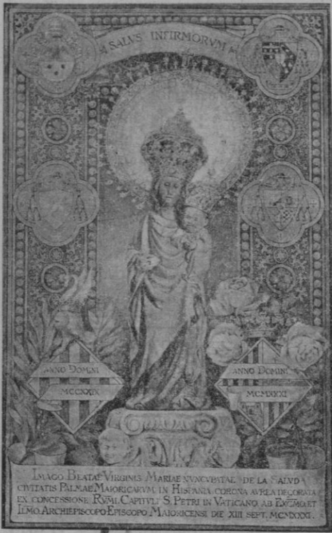
La Virgen de la Salud coronada pontificalmente. Cuadro que fué enviado a S. S. Pío XI para figurar en la galería de Vírgenes coronadas.