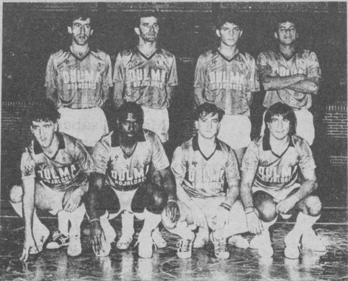
Formación del Dulma/Astorga para la temporada 89/90

El F.S. Cuéllar, también tiene trabajo el próximo fin de semana. El sábado juega en el polideportivo Santa Clara, frente al Universitario y el domingo, 12,30, en Torrejón de Ardoz, teniendo como rival al Marsanz. Pocas novedades, por lo demás, hay en el conjunto cuellarano.