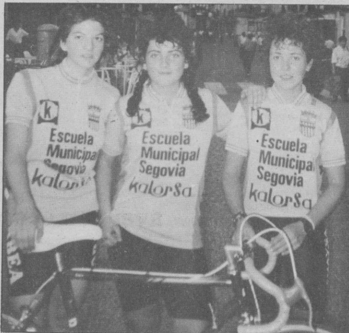
Buen papel de las ciclistas segovianas en tierras de Zamora.

Las chicas segovianas de la Escuela Municipal-Kalorsa tomaron parte en la prueba "I Trofeo Virgen del Canto", celebrada, para la categoría de féminas aficionadas y juveniles, en la localidad zamorana de Toro, sobre un recorrido de 60 kilómetros. La organización corrió a cargo de la Sociedad Ciclista Torsana.