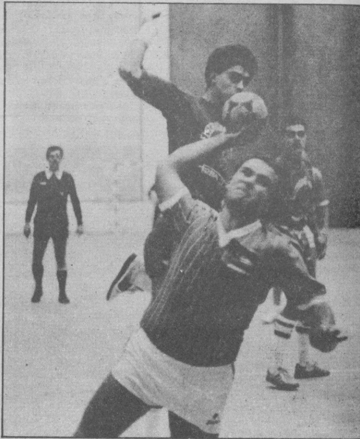
El balonmano va a comenzar competición en segunda

El próximo 22 de octubre dará comienzo la Liga en la Segunda División nacional de balonmano. En el grupo «A», con nueve equipos, forman, Autocid Burgos, Electricidad Alvarez, Caja Segovia, Optica Damián, S.D. Laciana, C.P. Bejarano, C.P.