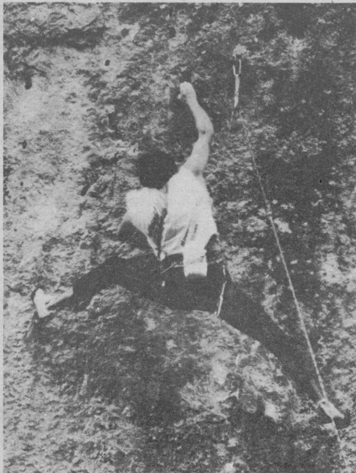
En montaña, los mejores

mera División nacional. De este equipo procede el segundo entrenador del equipo segoviano. Antes, el sábado, Caja Segovia jugará en Las Rozas, frente al Assesa, equipo de División de Honor. El partido de vuelta se jugará en Maristas el domingo a las 12 de la mañana.