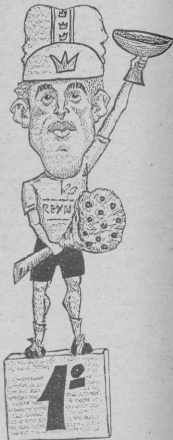
El Trofeo «Pedro Delgado»

El Club Ciclista 53 X 13, organiza la VIII edición del trofeo «Pedro Delgado», para corredores infantiles, alevines y principiantes. Será el próximo domingo a las 11 horas en el polígono de Hontoria. Habrá trofeos para los primeros y medallas para todos los participantes.