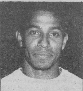
Ney, la figura del Hotachy

El otro equipo de León, en la División de Honor, Hotachy La