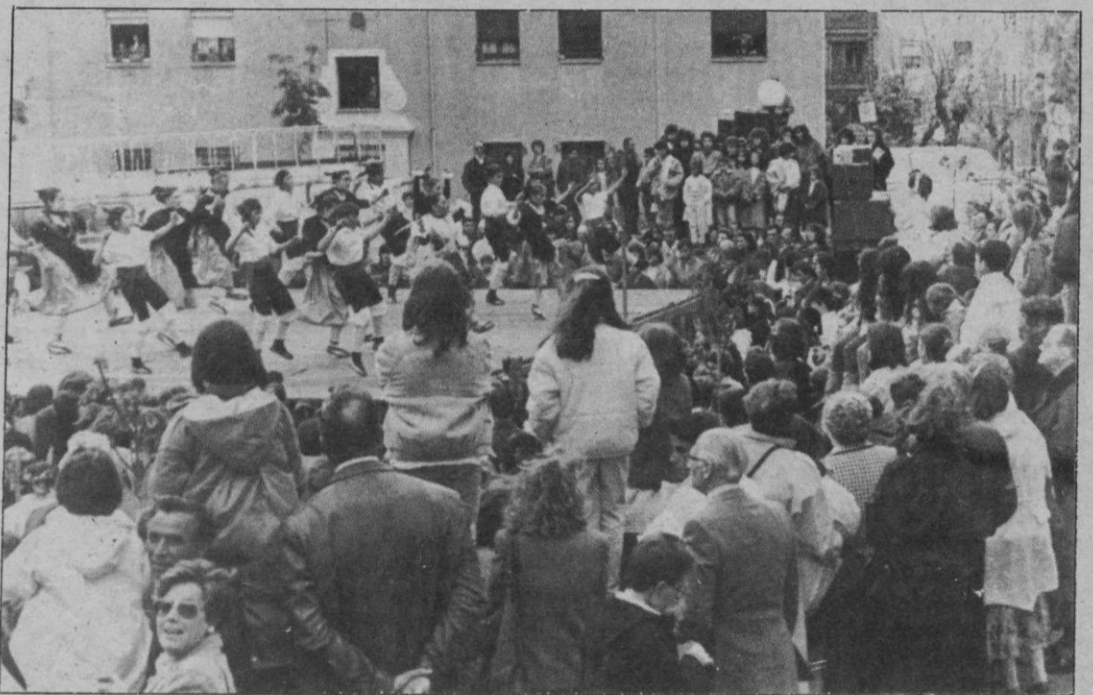
El festival folklórico de la plaza Ramiro Ledesma.

Numerosísimo público presenció en la tarde de ayer el festival folklórico que tradicionalmente se celebra el 1 de mayo en la plaza Ramiro Ledesma del barrio de San José, y que viene a constituir el más populoso de