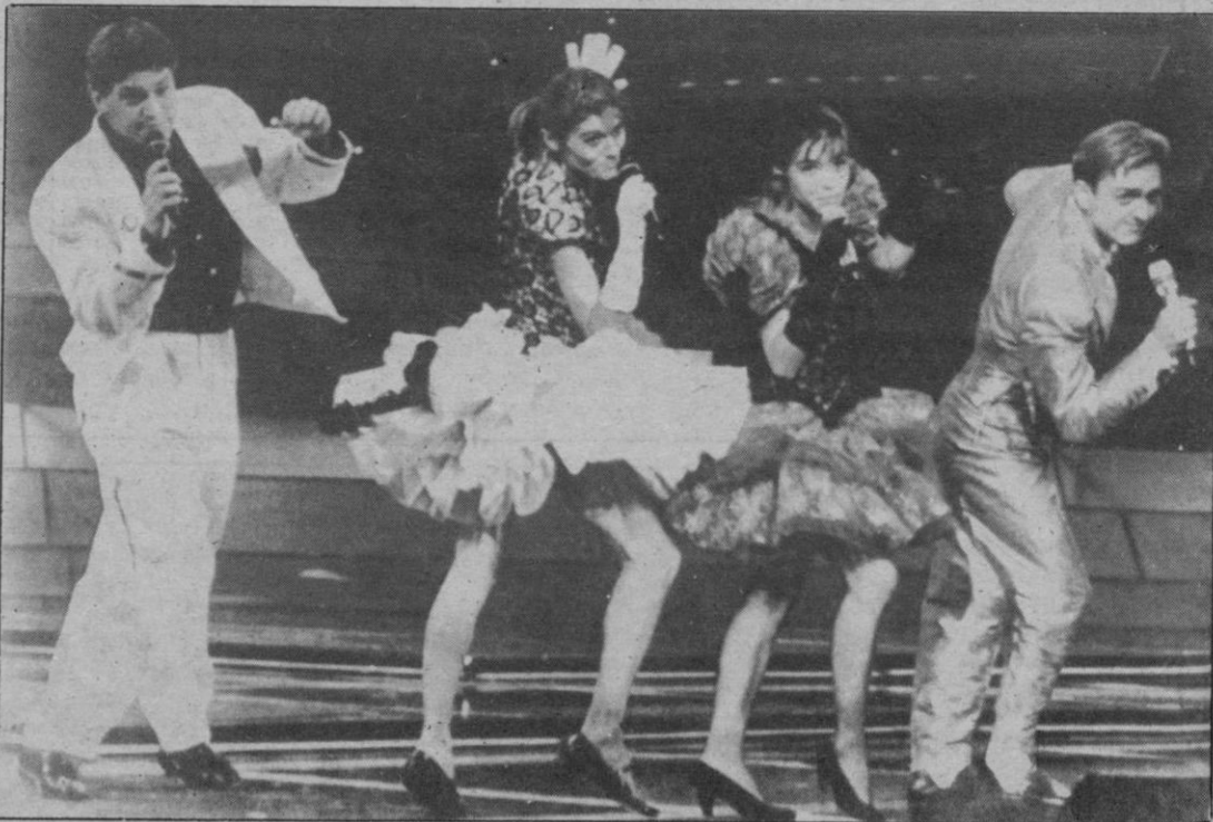
Dublín.— La Década Prodigiosa, grupo que con la canción «La chica que yo quiero» representó a España en el Festival de Eurovisión, que se celebró el sábado en Dublín

El festival se celebró en medio de grandes medidas de seguridad, y en un marco dominado por una espectacular profusión de colores, luces y flores naturales. Fue televisado a 500 millones de espectadores de toda Europa que siguieron desde sus hogares las tres horas de duración del programa.