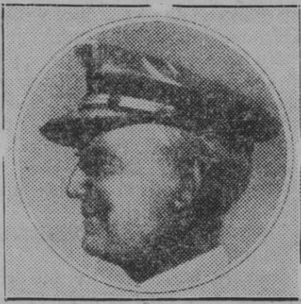
El contralmirante norteamericano, Mr. Meffet, que ha perecido en la catástrofe del "Akron".

El criterio que se expuso fué que la enseñanza racionalista, habrá de dar mejores frutos que la escuela laica, pues que ésta, según confesión de los propios revolucionarios, ha sido el más completo fracaso.