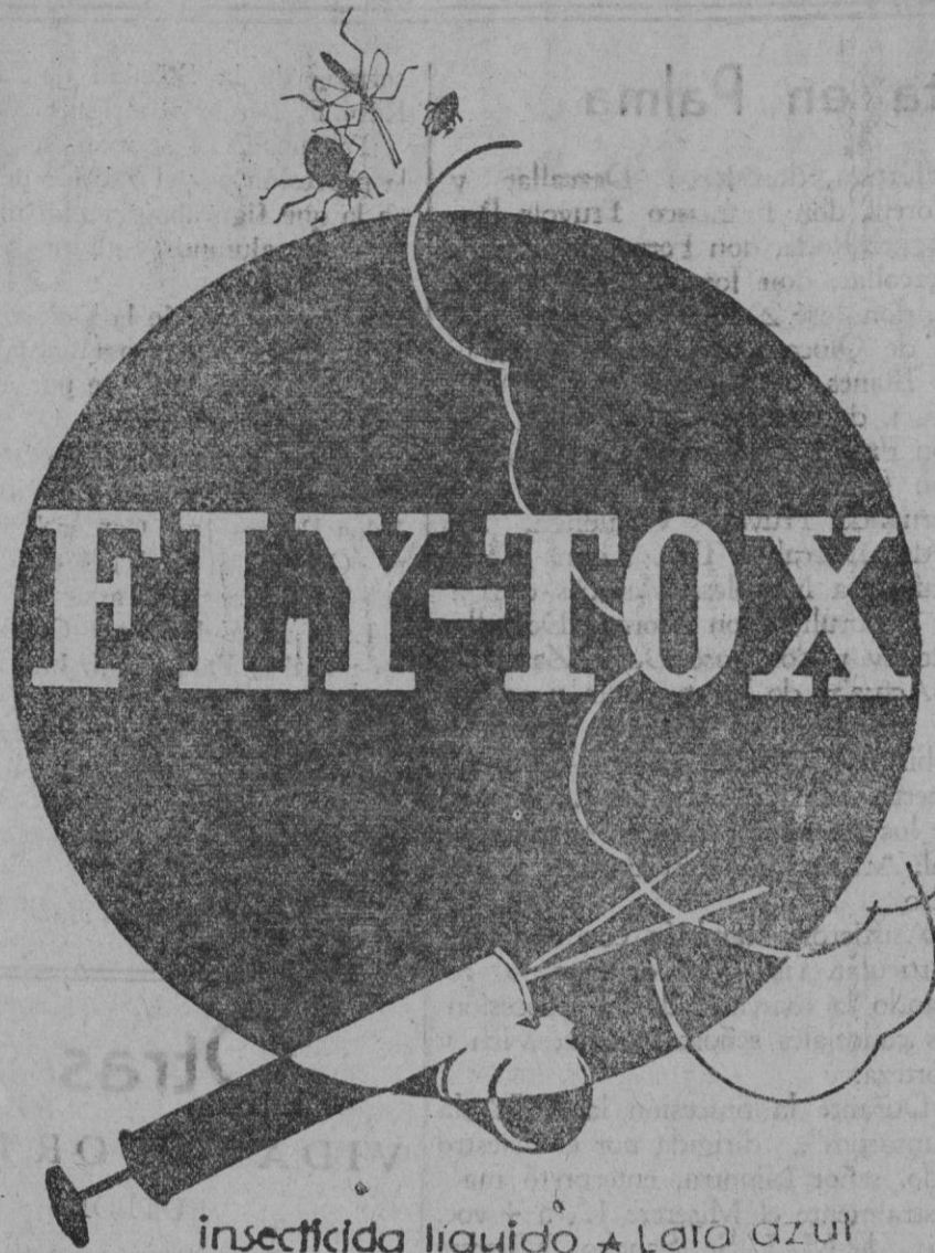
insecticida líquido * Lata azul

CALDO MAGGI LA MARCA DE CALIDAD 2 cubitos por 25cts.