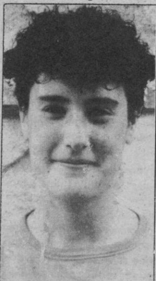
M. a Angeles: A recuperarse

No hay forma de que la corta plantilla de Jesuitinas