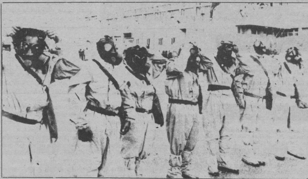
MUJERES-SOLDADOS EN LIBIA

su próxima reunión las iniciativas necesarias para que, tanto a nivel andaluz como nacional, se discuta la utilización de las bases de Rota (Cádiz) y Morón de la Frontera (Sevilla).—Efe