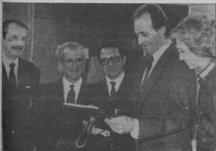
«MAS BONITO QUE UN SAN LUIS»

El Gobierno reitera «el no reconocimiento por España de cualesquiera medidas dirigidas a anexionarse los territorios árabes ocupados a partir de 1967, o alterar unilateralmente la naturaleza o el status de la ciudad de Jerusalén, cuyo libre acceso debe estar siempre abierto para todos», dice el comunicado.—Efe