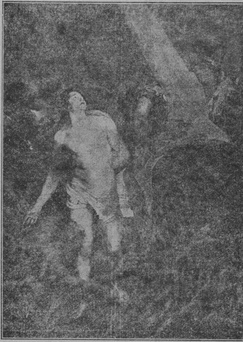
Cuadro de San Sebastián, de Van Dyk, que antes era expuesto en la tribuna de la Casa Consistorial el día de la festividad del Patrón de Palma.