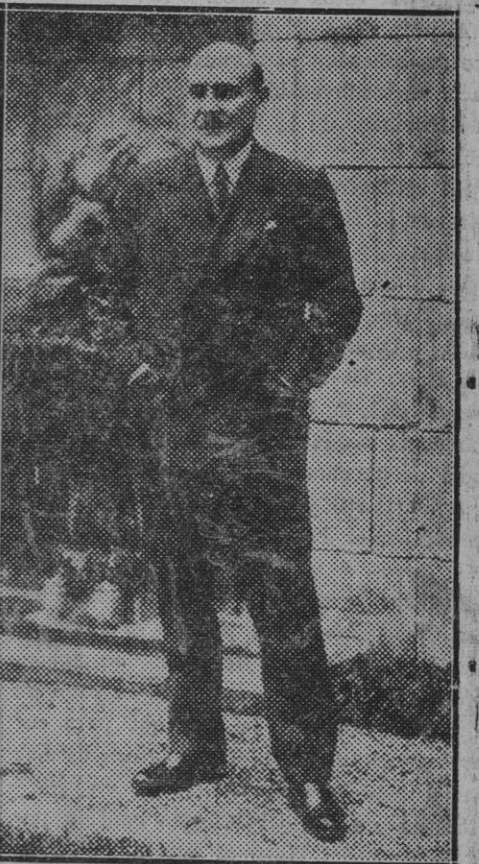
París. — M. de Jouvenel, nuevo embajador de Francia cerca del Quirinal, en el jardín de su casa, momentos antes de salir para Roma.

Su espesor es de 1'50 metros en la base y 0'40 en lo alto, lo cual le da una resistencia suficiente para elevarla 18 metros más, si fuera preciso.