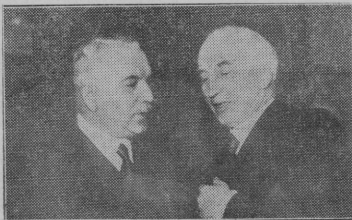
Ginebra. — Mr. John Simon y M. Von Neurath, ministros de Negocios Extranjeros de Inglaterra y Alemania, respectivamente, conferenciando después de una de las reuniones ginebrinas.

"Lo que se me debe es relativamente escaso, por que mi formación fué obra paciente y callada de mi madre muy amada, la Compañía de Jesús. A ella se debe la recta orientación, los refuerzos de espíritu y la perseverancia tan difícil a la débil naturaleza humana..."