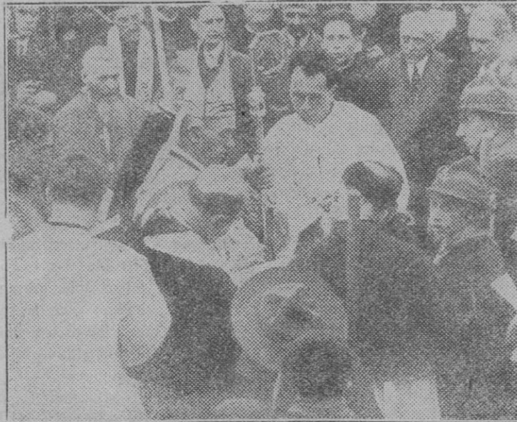
Enghien (Francia) — Bendición de la primera piedra de la futura Iglesia de las Misiones Católicas.