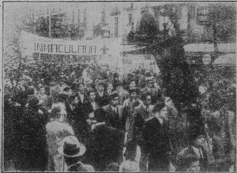
Barcelona. — Después de la misa celebrada en San Agustín, el requeté desfila en manifestación por las Ramblas.

Habló a continuación de como desde el primer momento nació la Asociación de Estudiantes Católicos con carácter francamente profesional y confesional y como por ello fueron combatidos por las otras agrupaciones, que han ido todas ellas desapareciendo, hasta quedar sólo la "flamante" Federación Universitaria Española, formada por estudiantes y estudiantas honorarios que hasta ahora no han hecho más que producir perturbaciones hasta