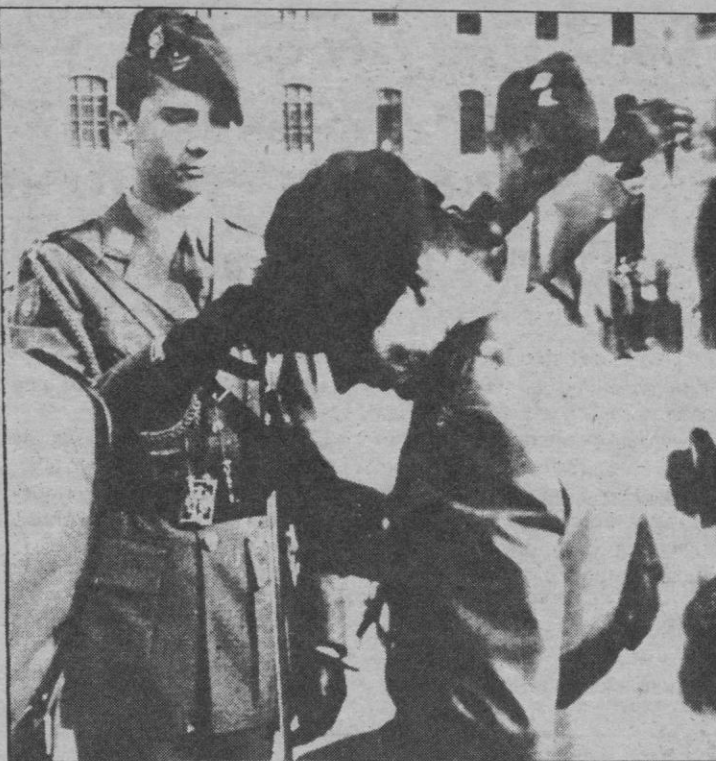
EL PRINCIPE APADRINA A UN CADETE