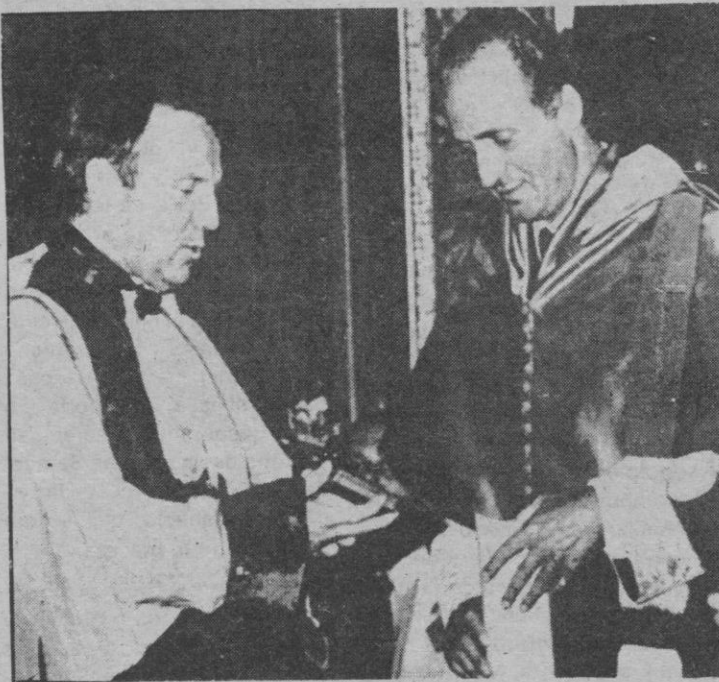
El Rey Juan Carlos recibe la medalla de manos del presidente de la Universidad de la Sorbona durante el acto de investidura como doctor «honoris causa».