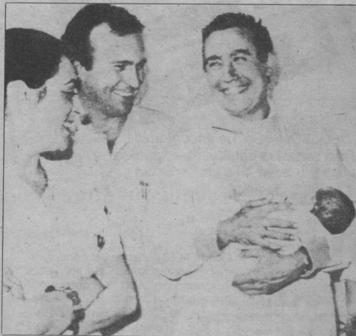
PRIMER «NIÑO-PROBETA» EN UN HOSPITAL DE LA SEGURIDAD SOCIAL

UNA POSIBLE Ley de Amnistía para los militares participantes en la represión ilegal del terrorismo en Argentina, fue descartada por el ministro de Justicia y Educación, Carlos Alconada Aramburu.