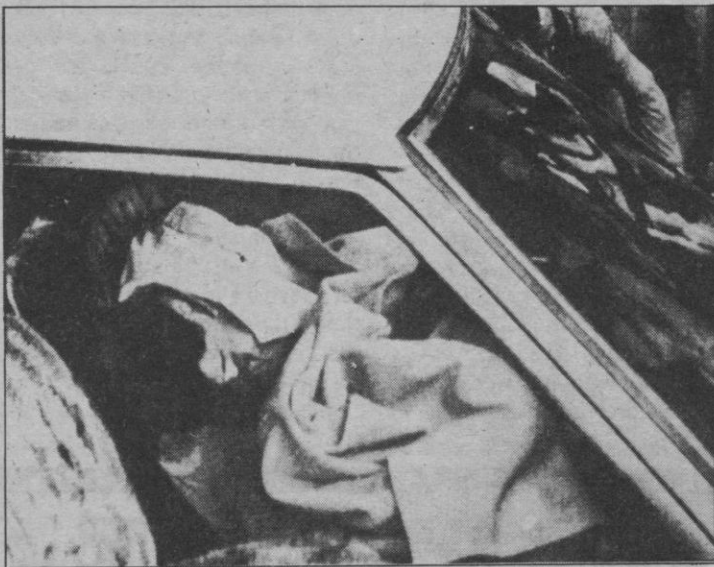
DOS GUARDIAS CIVILES, ASESINADOS EN SAN SEBASTIAN.—En la imagen, una de las víctimas en el lugar del criminal atentado

Barrionuevo presidió el acto acompañado de altos cargos de su Departamento