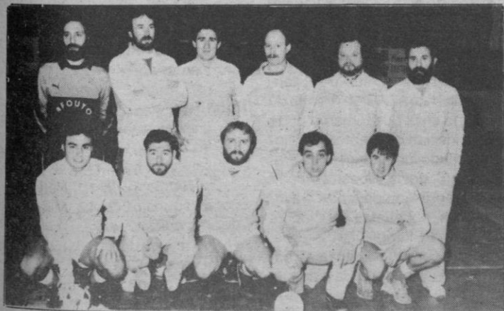
Orereta: No pudo

En la segunda se había olvidado todo y de nuevo mandaron sobre la cancha. Su contraataque funcionaba como hacía mucho tiempo que no veíamos y ello obligaba a los jugadores de ORERETA a mantener sus líneas zagueras con mayor número de efectivos. Dos goles de LA ESCUELA en un periodo de tres minutos determinaron el resultado final del encuentro. Es cierto que los locales lucharon hasta el último segundo. Trabajaron lo indecible por intentar, cuando menos, el empate. Pero la