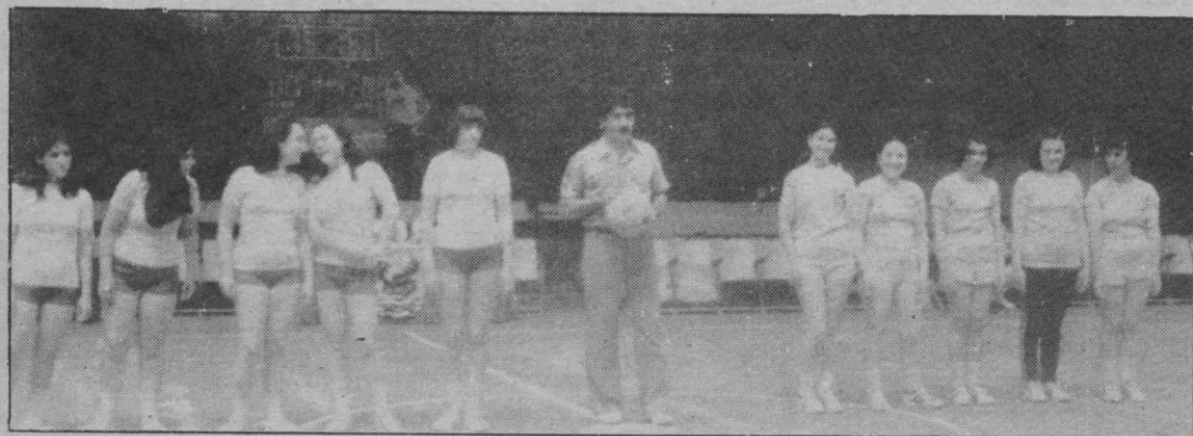
Baloncesto, también tratado especialmente

De todos modos, el partido fue muy sobrio y bien disputado por los dos contendientes con un fútbol vibrante y rápido. Cuando el Cindasa logró batir la portería adversaria con dos goles en un corto espacio de tiempo, el ritmo del partido decreció y el que sería vencedor de la Copa se limitó a controlar el partido sin importarle la galería y a lanzar esporádicos contraataques que casi siempre pillaban desguarnecida a la defensa del Centro, pero que no se transformaron en goles porque ya las fuerzas comenzaban a fallar a esas alturas del partido. El arbitraje fue muy acertado ya que las técnicas que sacó fueron las justas y en situaciones cruciales para evitar que se le fuera el partido de las manos. Como colofón se procedió a la entrega de trofeos a los distintos ganadores y la mejor prueba de la camaradería, que reinó en todo momento, fue la merienda que degustaron los jugadores de los dos equipos una vez que la ducha calmó los ánimos.