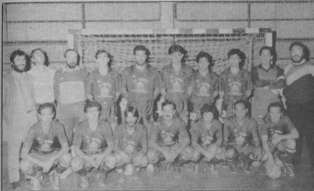
La Escuela: Llegó el ansiado triunfo

Las partidas se interrumpieron el 15 de febrero cuando Karpov iba ganando por 5-3 a un Kasparov en línea ascendente.