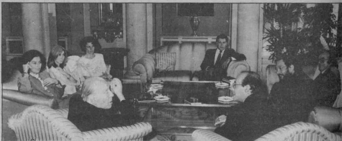
MADRID.— El escritor argentino Jorge Luis Borges, almorzó ayer con el presidente del Gobierno, Felipe González, y su esposa,

La ley será aprobada mañana con toda seguridad, según manifestó ayer mismo Miguel Boyer, pero su entrada en vigor no se producirá hasta el 1 de enero del próximo año, tras su paso y aprobación por parte del Parlamento.