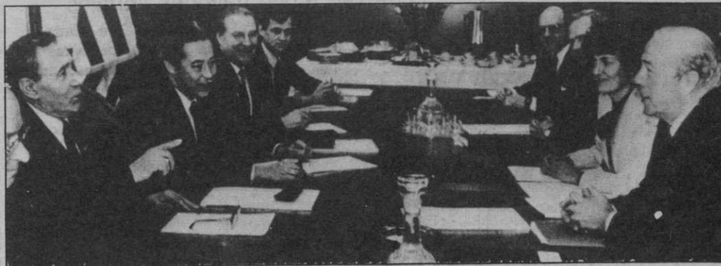
El ministro de Asuntos Exteriores de la Unión Soviética (izquierda), señala hacia el secretario de Estado norteamericano George Shultz (derecha), al comienzo de la cuarta sesión de las conversaciones para reanudar las negociaciones sobre control de armamento nuclear, mantenido ayer tarde en la sede diplomática norteamericana.

Catorce horas y media han durado en total las conversaciones entre los ministros de Asuntos Exteriores de Estados Unidos, George Shultz, y de la Unión Soviética, Andrei Gromiko, reunidos en Ginebra (Suiza) el lunes y el martes para tratar de desbloquear la negociación para el control de armas nucleares. Aunque oficialmente no existe la menor filtración sobre el contenido de las agotadoras entrevistas, medios diplomáticos occidentales afirman que el encuentro permitirá establecer las bases para una futura entrevista «más fructífera en acuerdos concretos».