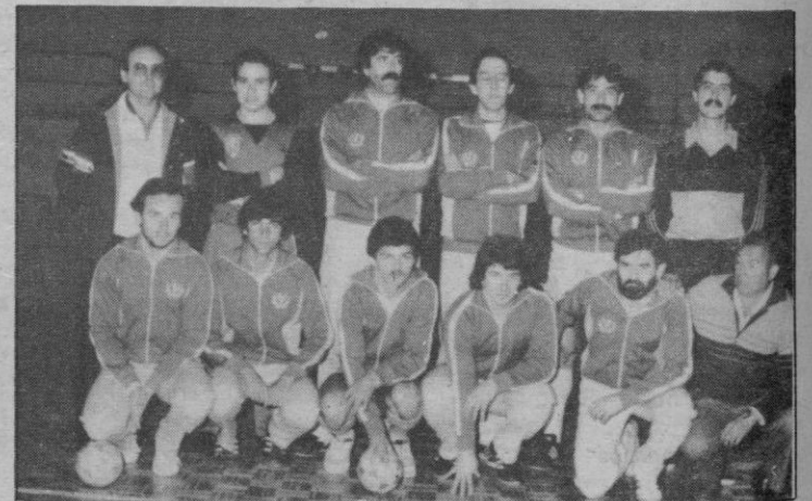
Toledo F. S.

talán, valenciano o vasco dirige encuentros en los que juegan equipos de esas regiones, no hay forma de ganar. Si aquí jugamos frente a uno de esos equipos y nos dirige un árbitro