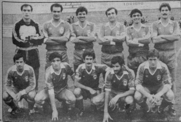
El Avila puede dar mucho «juego» en Leganés