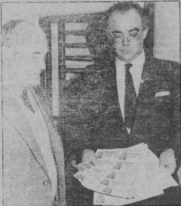
Los décimos que tiene en la mano el director de la Caja Rural de Valladolid valen 12.500 millones de pesetas. A él le han correspondido cuarenta y cinco