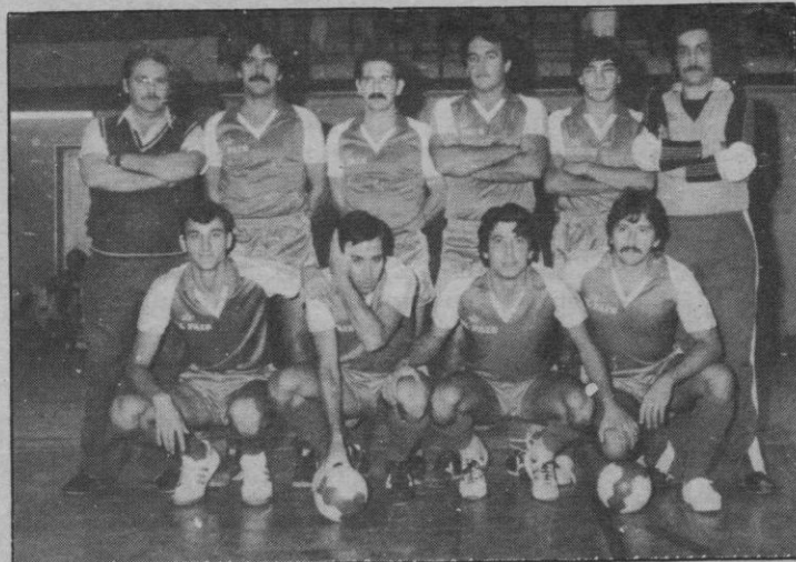
«El País»: La Escuela debe puntuar