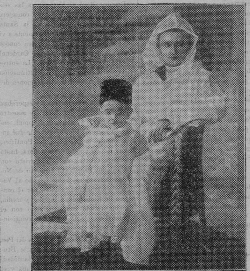
Paris. — El Sultán de Marruecos fotografiado en compañía de su hijo a su llegada a la capital de Francia.