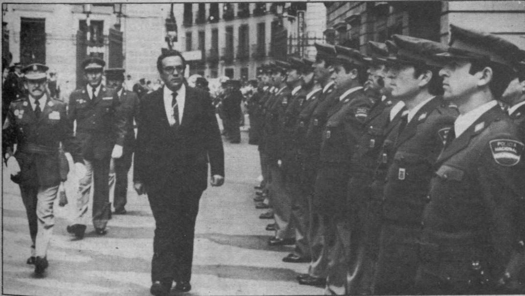
POLICIA NACIONAL PARA EL CONGRESO

El donante fue un joven de 20 años que ingresó en la residencia Príncipes de España de Bellvitge, tras sufrir un grave accidente de tráfico en las cercanías de Barcelona que le costó la vida.