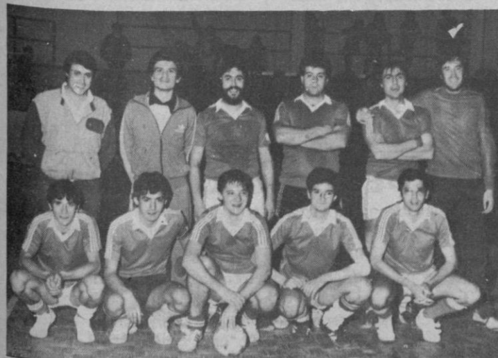
Equipo del Narizotas que fue brillante vencedor en el IV Torneo UNICEF