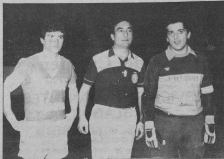
Capitanes y árbitro antes del partido