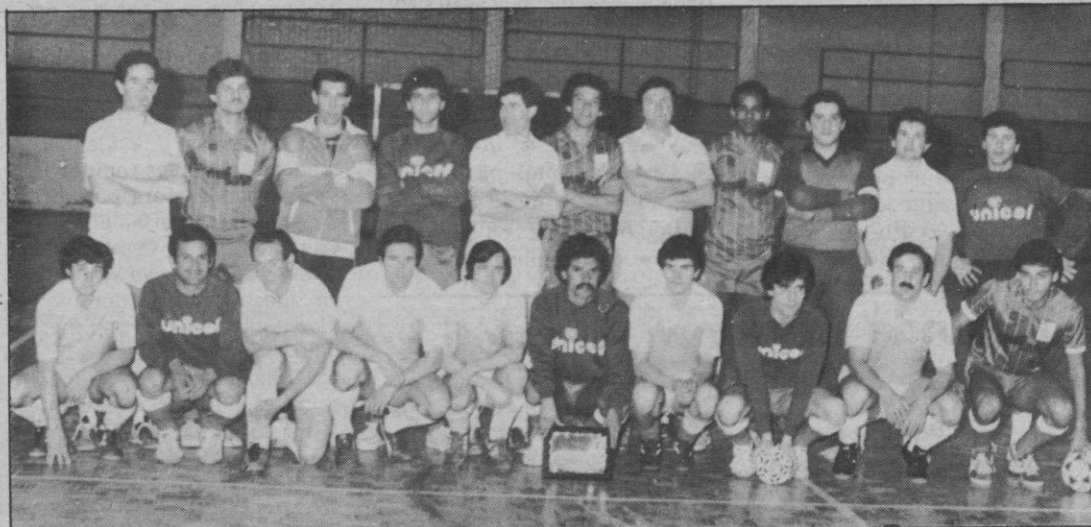
Jugadores brasileños y segovianos antes del comienzo del encuentro que resultó muy entretenido