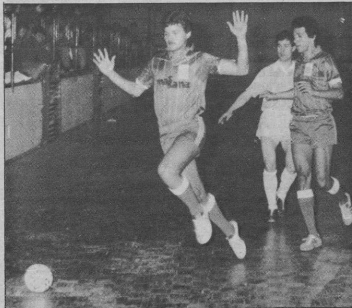
Avance del equipo brasileño a la puerta segoviana

char las ocasiones. MARINO, que reaparecía, ofreció un gran juego y demostró que su falta ha sido imprescindible en el conjunto. Luego, en la continuación, y quizás porque VOGUE no marcó también a sus oponentes y también porque no estuvo «fino» en sus oportunidades, el partido cambió de rumbo y con el juego brillante de Luis —su primer gol fue excelente—,