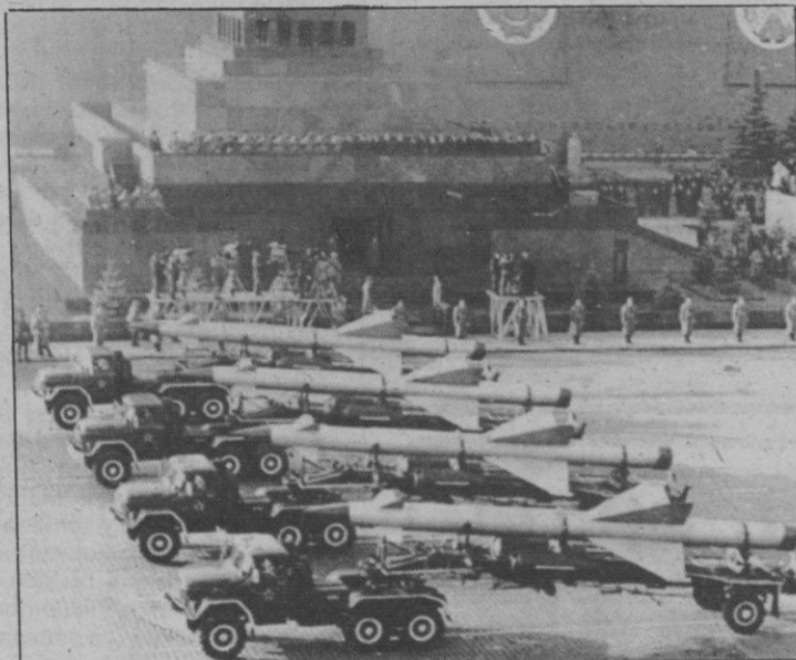
Moscú.— Remolcados por pontones camiones, misiles soviéticos cruzan la Plaza Roja de Moscú, durante el tradicional desfile militar conmemorativo de la Revolución de Octubre

El Grupo Centrista presentó 80 enmiendas, y por lo que respecta al Grupo Mixto, los comunistas presentaron 30, y el CDS, 42.— Efe