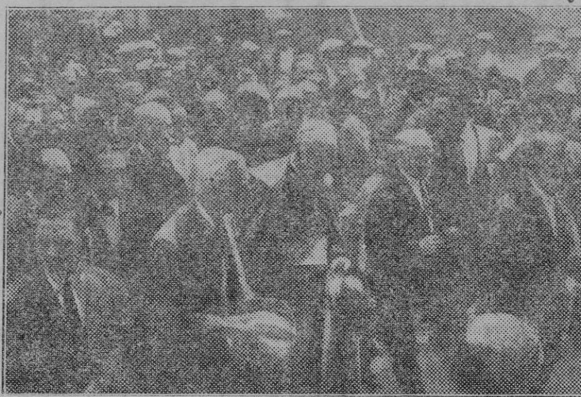
Solsona. — El presidente de la Generalidad dirigiéndose al Ayuntamiento, acompañado del obispo y otras personalidades.