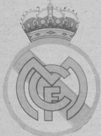
El club blanco será difícil en La Albuera

Titubeante comenzó el equipo blanco la liga para posteriormente ir cogiendo ritmo al te-