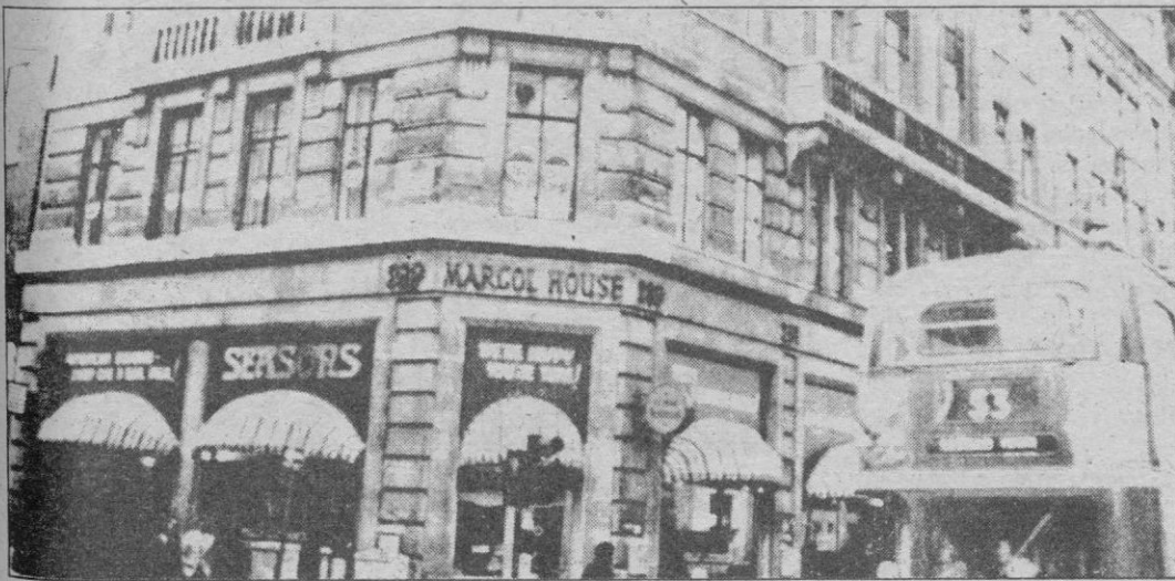
Edificio que ocupa Rumasa en Londres

Londres.—La confusión que rodea la estructura de Rumasa en España se ha contagiado a las empresas extranjeras del «holding». Expertos españoles intentan descifrar en Londres la situación exacta de las empresas de Rumasa en el Reino Unido, sin que, al parecer, hayan podido arrojar mucha luz. La confusión aumenta debido a los rumores sobre la presencia de José María Ruiz-Mateos en la capital londinense y a la actitud de los representantes de las distintas compañías del grupo, algunos de los cuales niegan su relación con Rumasa mientras que otros han preferido abandonar Londres.