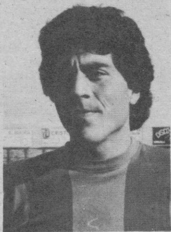
Mata: Un puntal fuerte en la G. Segoviana.