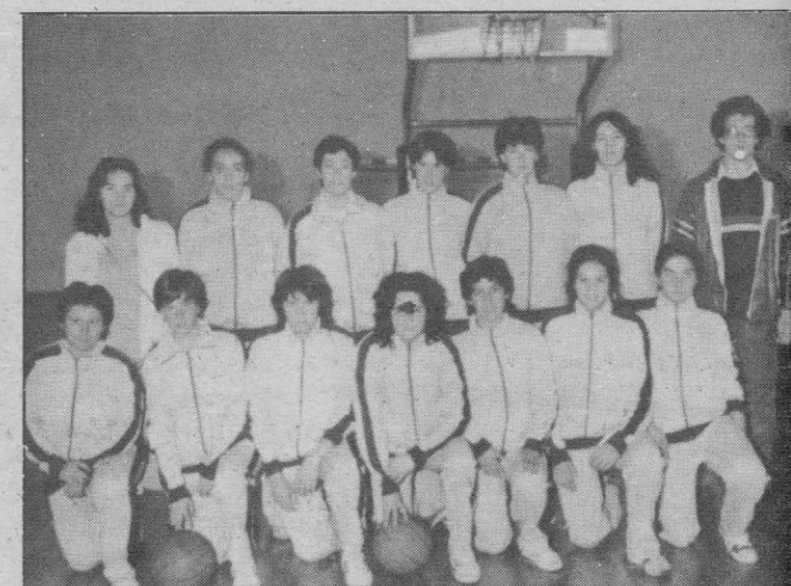
JESUITINAS: «El todo por el todo»

de toda una brillante temporada las componente del equipo segoviano. Si se consigue ganar, o cuando menos, empatar, se empezará a pensar en la fase clasificatoria de Orense. Y conste que no es nada fácil el equipo burgalés, que en la pasada jornada venció al difícil Manasult en su propio feudo. Es cierto que su clasificación —la de las locales— no va a mejorar mucho más con su posible victoria ante las segovianas, pero intentarán vencer a uno de los mejores equipos del grupo. Esperemos que el arbitraje sea todo lo imparcial que de un colegiado se espera siempre. Suerte.