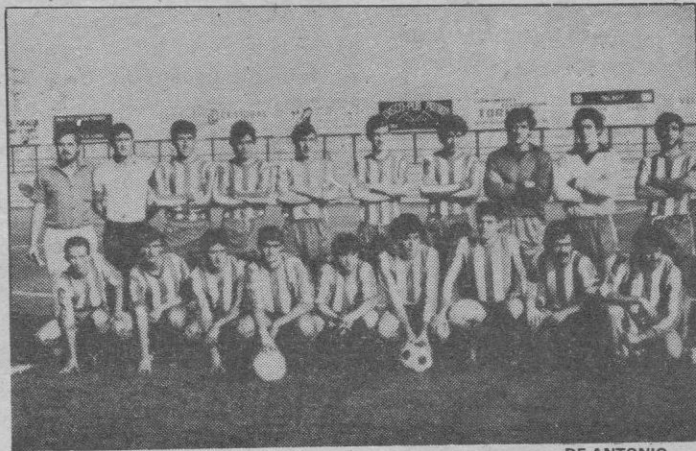
C. D. ACUEDUCTO.