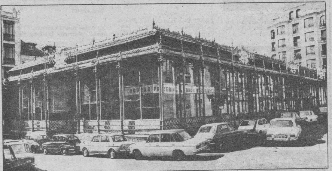
El mercado de San Miguel, situado en la calle del mismo nombre, junto a la plaza Mayor, en Madrid, uno de los más conocidos y tradicionales de la ciudad, será declarado monumento histórico-artístico, según la resolución de la Dirección General de Bellas Artes, que ya ha acordado la incoación del expediente correspondiente. El mercado se caracteriza por su espléndida construcción metálica combinada con cristal.

El órgano del Partido Comunista Soviético afirma que la renuncia de Rostow, solicitada por el presidente Ronald Reagan, es resultado de «la incompetencia de los funcionarios encargados de elaborar propuestas sobre desarme».—Efe