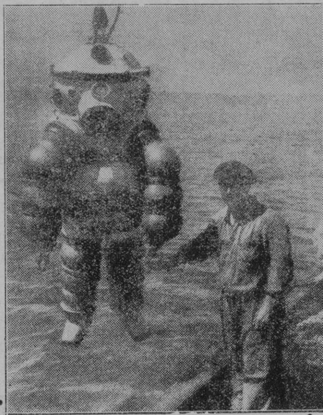
En busca de un hidroavión perdido en la Costa Brava.

La suma gravedad del caso, impropio de nuestra época de progreso, no se ocultará a la fina comprensión y criterio católico de V. E., porque conoce V. E.,