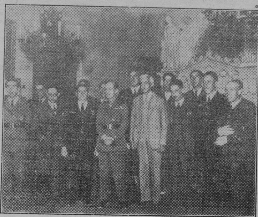
Barcelona. — En el Palacio de la Generalidad Recepción de los oficiales aviadores de la escuadrilla de Getafe