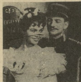
Brigitte Bardot e Yves Robert, en una escena de este film.

El que en una ciudad provinciana está acuartelado un Regimiento de Dragones es siempre motivo de orgullo municipal, pero también es peligroso detonante para los asuntos del corazón. Los uniformes visten mucho y los vibrantes toques de corneta pueden sonar a rebato en el interior de las jovencitas —y las maduras— del censo ciudadano. En es-