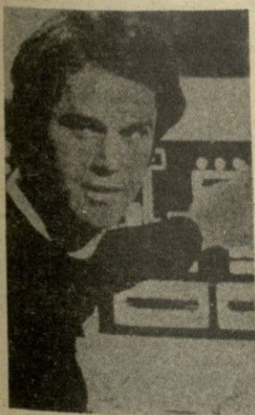
Logan-Cinco, protagonista de esta serie de ciencia-ficción, es interpretado por Gregory Harrison.

Los fugitivos llegan a una ciudad semidestruida por la última guerra nuclear en el año 2130. en un edificio, escuchan un mensaje grabado 200 años atrás, en él indican que en el sótano se en-