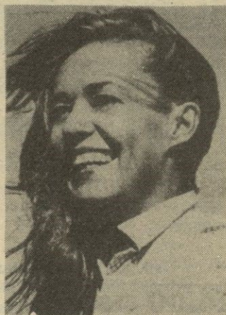
Jeanne Moreau, protagonista femenina de esta película.

Lidia y su marido, el escritor Giovanni Pontano, enclavados dentro de la alta burguesía italiana, cumplen con sus actividades de una jornada más en su vida de siempre: visitan a su amigo Tomaso, afectado de una enfermedad incurable; asisten después a la presentación del último libro de Giovanni; luego a un espectáculo y, por la noche, a una fiesta de la alta sociedad donde, en un contexto de conversaciones banales y cínicas, acaban por sentirse extraños. Allí, Giovanni entabla amistad con Valentina, una joven que también se aburre e esa fiesta y cuyo padre, un próspero empresario, ofrece al escritor la posibilidad de trabajar en el departamento de cultura y de publicidad de su compañía. Al amanecer, finalizada ya la fiesta, Li-