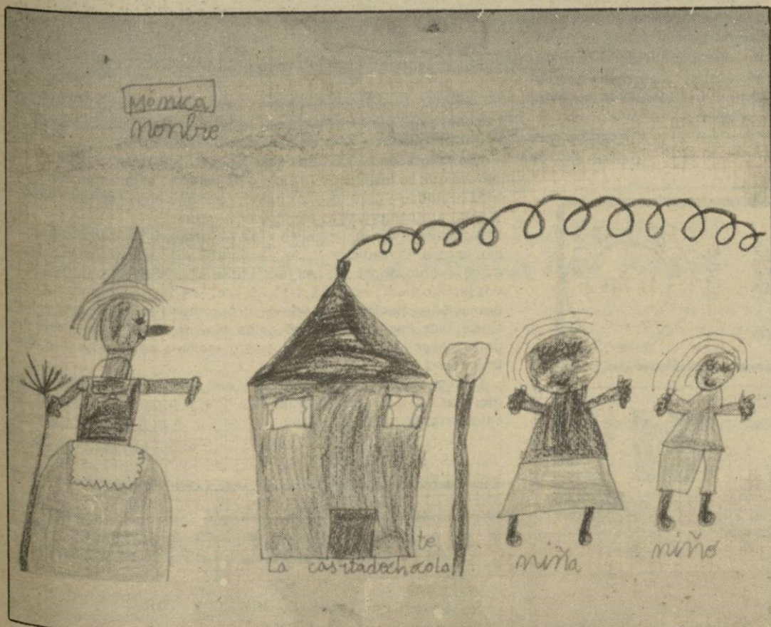
AUTORA: Mónica Sanz San Félix (6 años). SEGOVIA