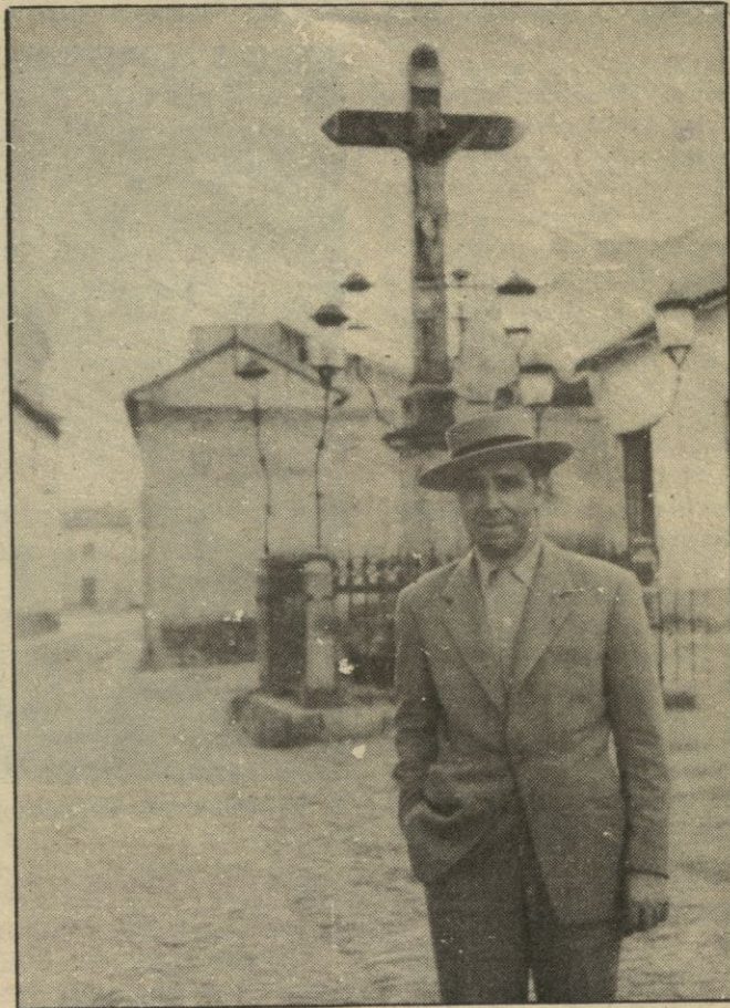
Ante el Cristo de los Faroles, en Córdoba.

El maestro Torroba, en 1934, me contrató como tenor con pri-