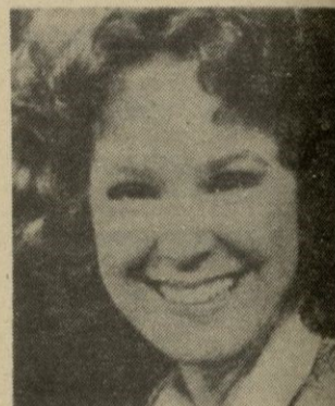
La periodista Billie Newman es interpretada por Linda Kelsey.

Un famoso abogado, Claude Cunningham, accede a llevar la defensa de un presunto homicida, acusado de dar muerte a su mujer, el abogado, a quien interroga Billie, destacada por «La Tribuna» para infor-