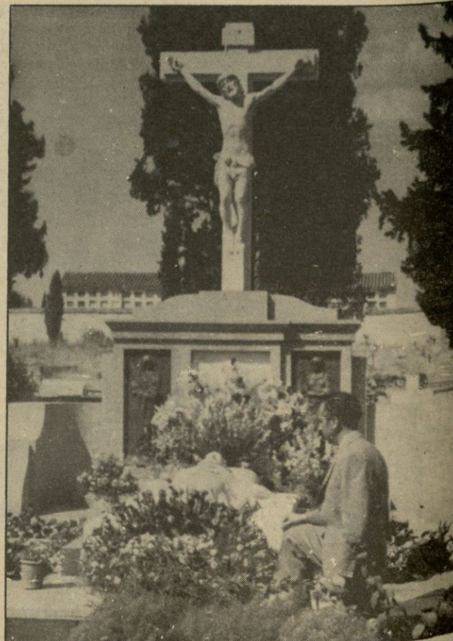
Rezando ante la tumba de Manolete